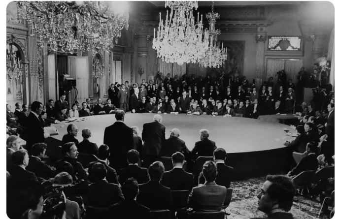
Quang cảnh lễ ký kết chính thức Hiệp định Paris

Từ sau Hiệp định Giơnevơ 1954, đế quốc Mỹ nhanh chóng nhảy vào miền Nam, thế chân thực dân Pháp, biến miền Nam Việt Nam thành thuộc địa kiểu mới. Việt Nam một lần nữa trải qua cuộc chiến tranh trường kỳ, bền bỉ chống Mỹ để đi tới việc ký kết Hiệp định Paris, ngày 27 tháng 1 năm 1973.