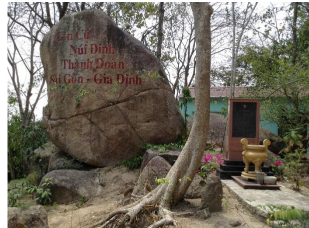
Khu căn cứ cách mạng Núi Dinh

Hãy cùng nhấp chọn vào đường link bên dưới để xem phim tư liệu về căn cứ cách mạng Núi Dinh để hiểu thêm về quá trình chiến đấu của các thế hệ cha, anh của chúng ta các bạn nhé!