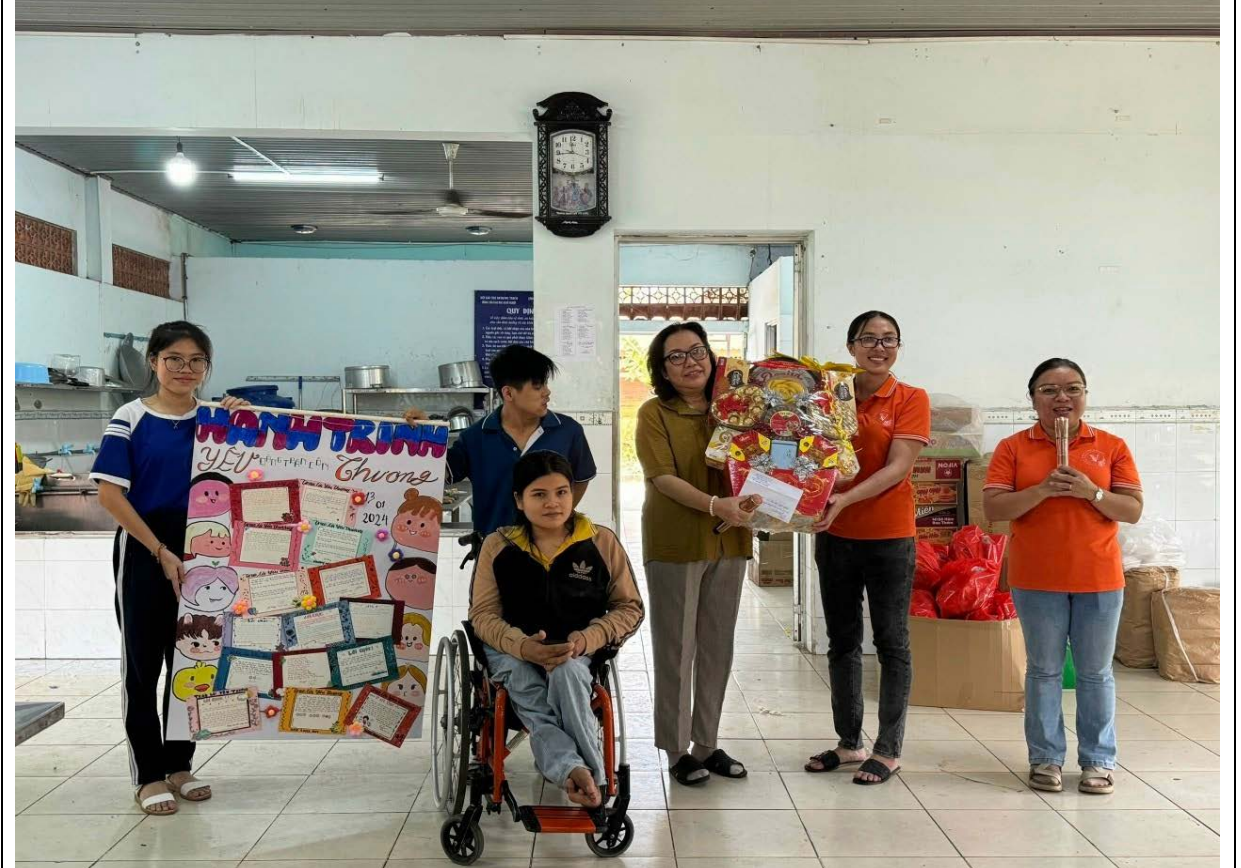
Học sinh và thầy cô giáo trao tặng những phần quà cho các em ở trung tâm

Qua chuyên đề: “HÀNH TRÌNH CỦA YÊU THƯƠNG” đã giúp học sinh được tham gia nhiều hoạt động, trải nghiệm mới mẻ, bổ ích. Đồng thời qua đó học sinh hiểu được ý nghĩa của sự yêu thương, sẻ chia đến những mảnh đời bất hạnh trong cuộc sống./.