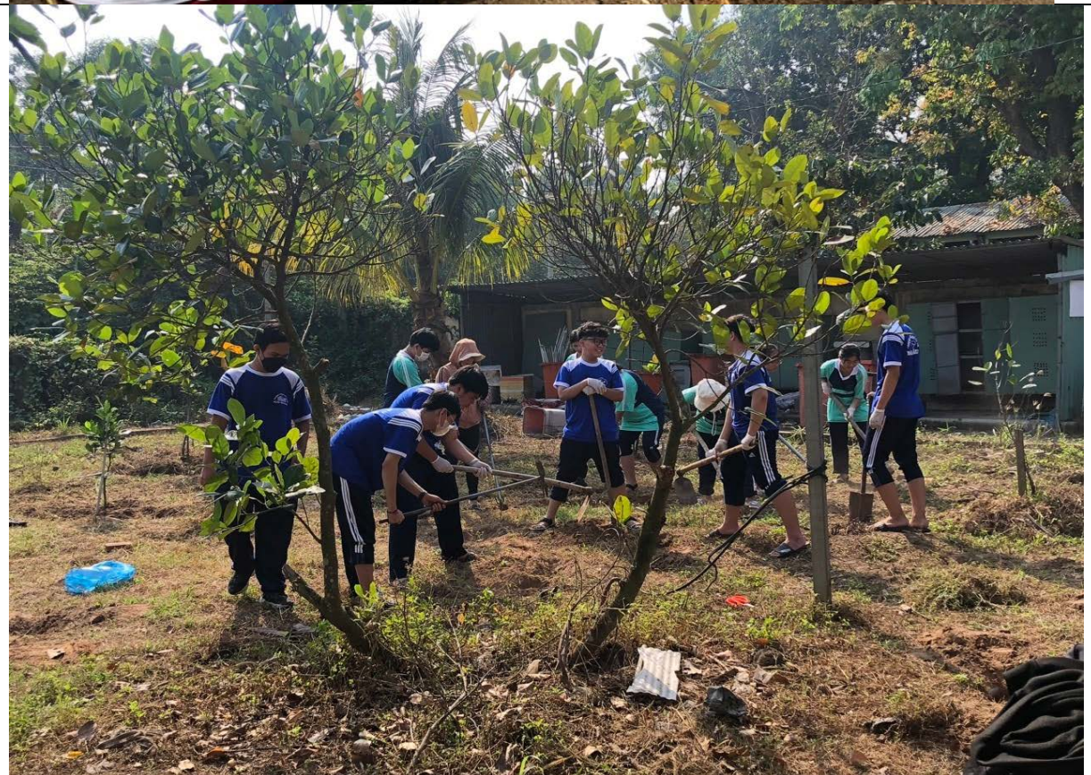
Học sinh tham gia hoạt động “Trồng cây ăn quả và vườn rau nghĩa tình”