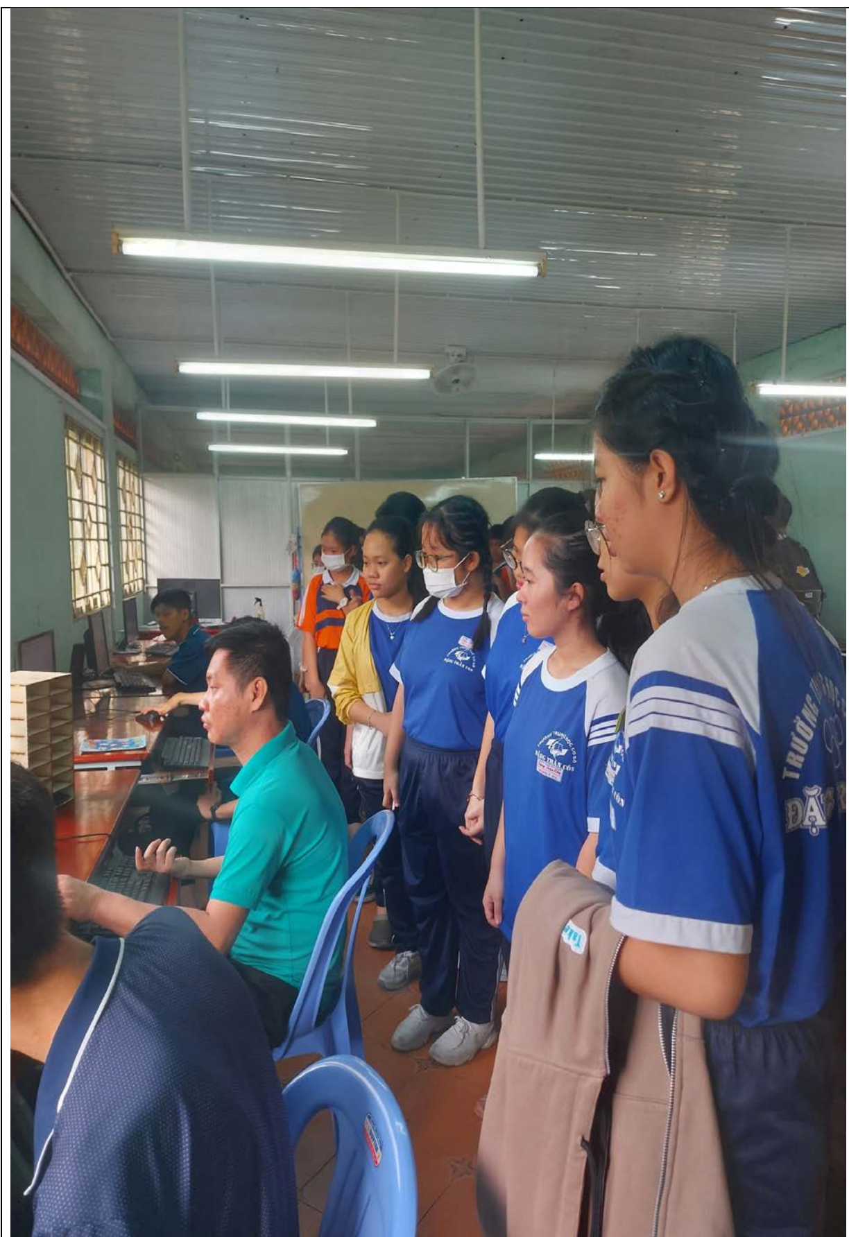
Học sinh tham quan lớp học đồ họa