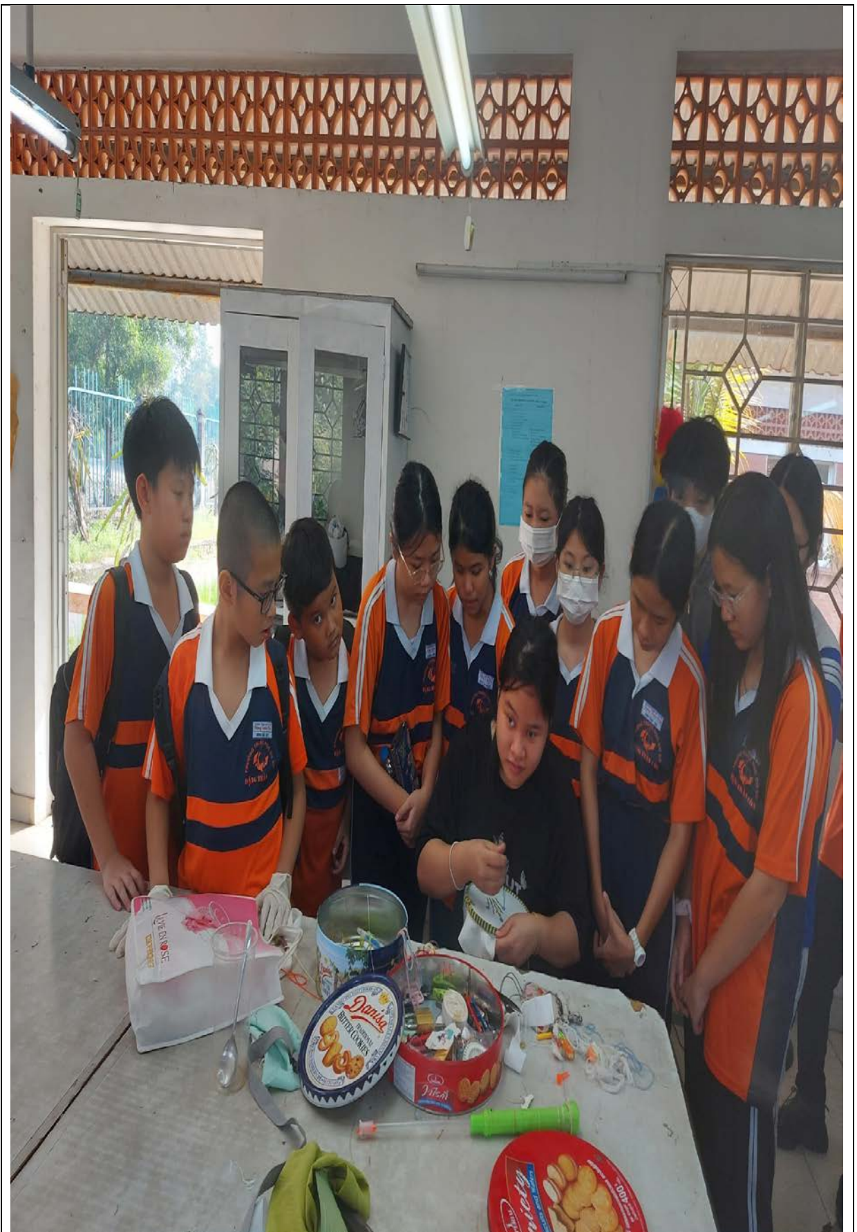
Học sinh tham quan lớp học may và thêu