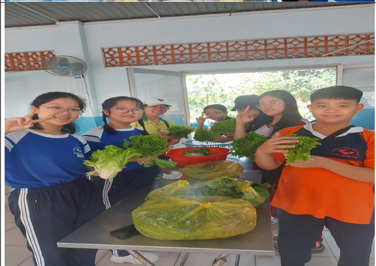
Học sinh tham gia hoạt động “Bếp yêu thương”