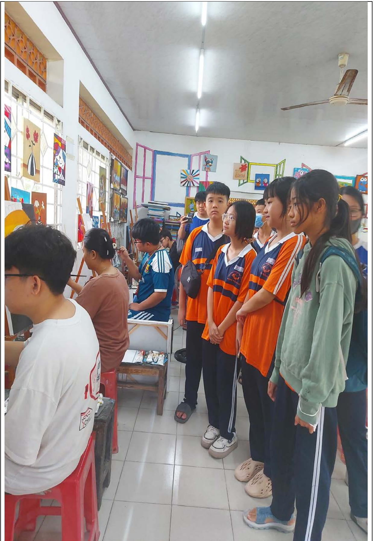
Học sinh tham quan lớp học vẽ tranh sơn dầu