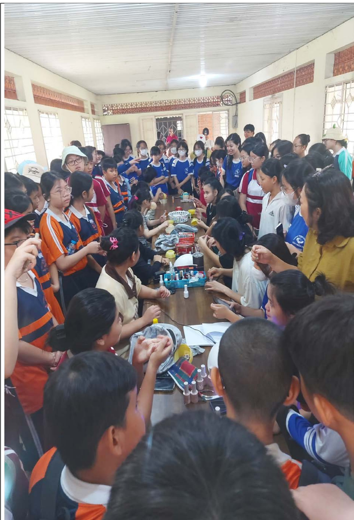
Học sinh tham quan lớp học Nail