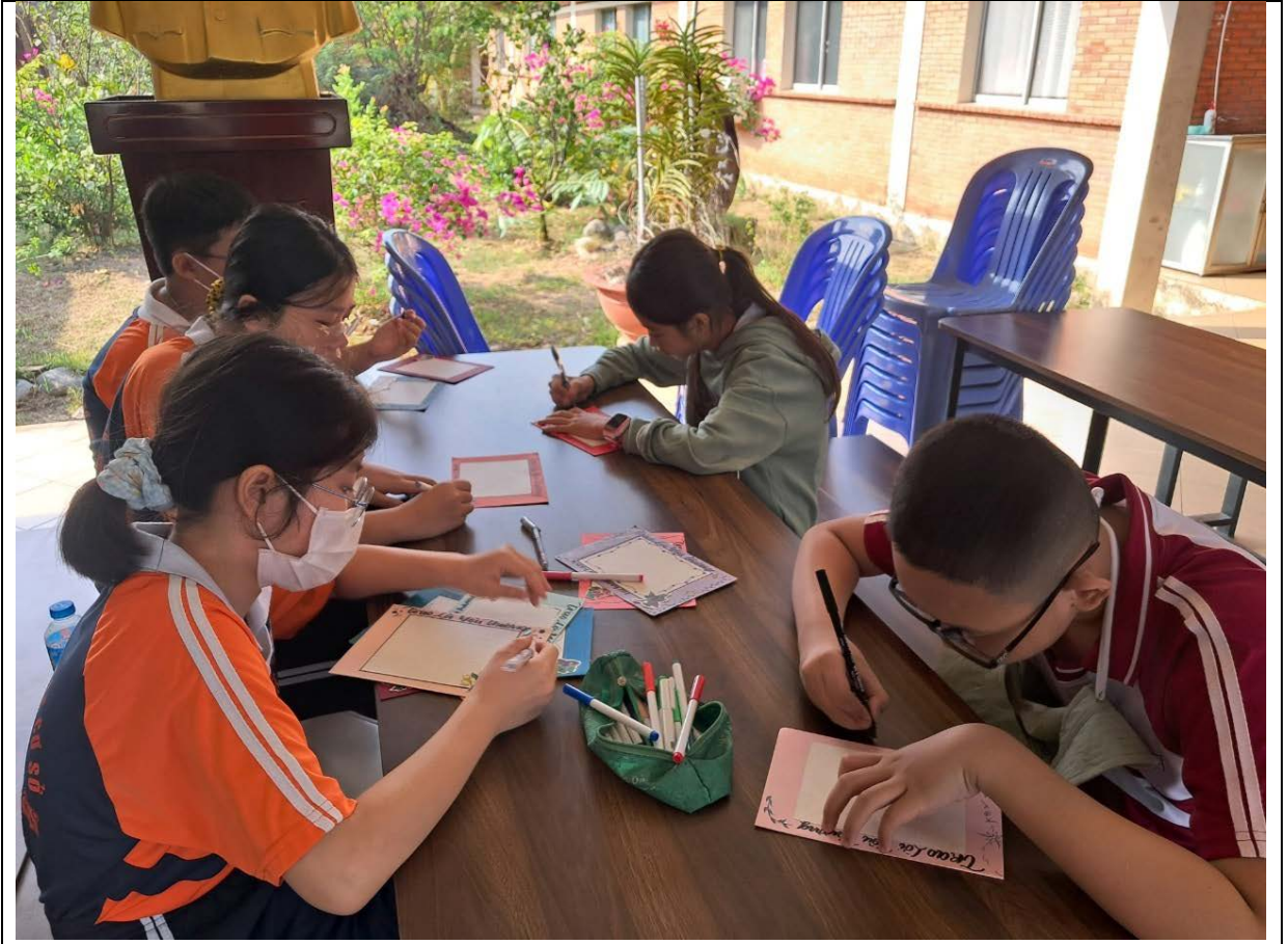
Học sinh tham gia hoạt động “Bức tranh yêu thương”