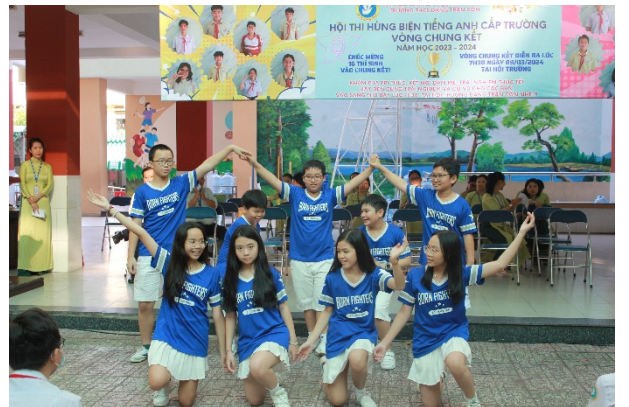
Tập thể lớp 6/3 với tiết mục nhảy yêu lắm, tò te tí

Chương trình cũng sôi nổi với Gameshow Đoán tên bài hát và giao lưu với khán giả: