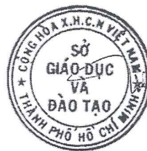
Dương Trí Dũng