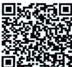
Luật Căn cước