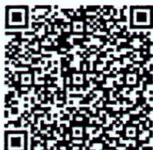
Tờ bướm tuyên truyền Luật Căn cước