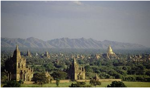
Kinh đô chùa Pa-gan (1044 – 1285)