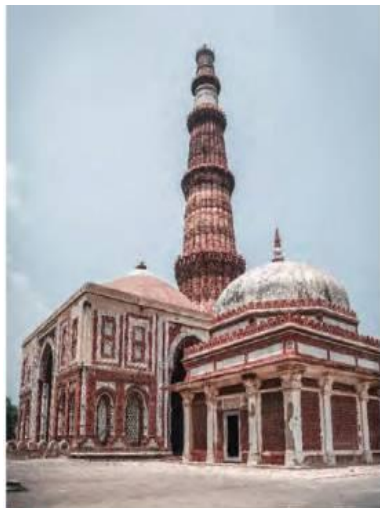
Phức hợp nhà thờ và tháp Kutub Minar cao 73 mét (Đêli, thế kỉ XII – XIII)

Với đặc trưng rất dễ nhận biết bởi các tháp cao, mái vòm, cửa vòm, sân rộng và họa tiết trang trí bằng chữ A-rập cổ. Đó là công trình kiến trúc theo kiểu