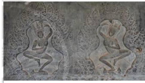
Vũ nữ Apsara (phù điêu, đền Ăng-co Vát, thế kỉ XII)