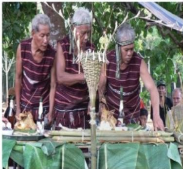
Nghi thức cúng Thần Lúa

Lễ cúng thần lúa của người Cho-ro giúp người đọc hình dung rõ hơn về nghi thức và hoạt động trong buổi lễ này.