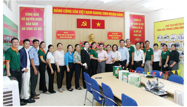
Các đại biểu chụp ảnh lưu niệm tại lễ ra mắt “Không gian văn hóa Hồ Chí Minh” tại Chi bộ Trung tâm ASXH TP Thủ Đức.

ra mắt mô hình cắt tóc miễn phí và tử thời trang “Thủ Đức nghĩa tình” với phương châm “Ai thừa đến cho, ai cần đến nhận” dành cho các đối tượng là học sinh, sinh viên, công nhân, người lao động có hoàn cảnh khó khăn trên địa bàn TP Thủ Đức.