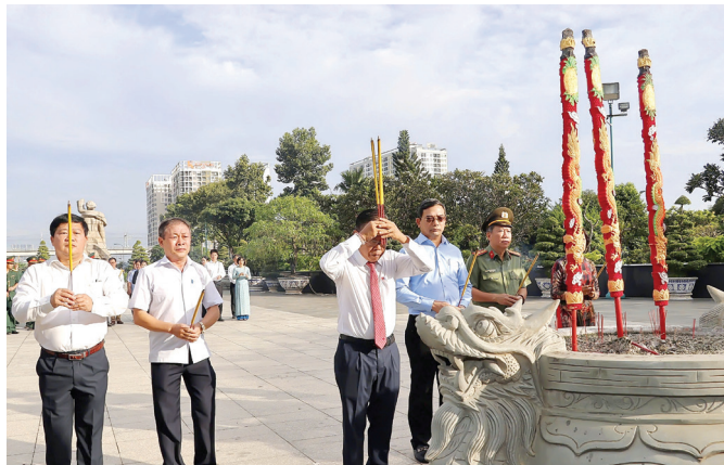
Đoàn 1: Đoàn đại biểu dâng hoa, dâng hương tại Nghĩa trang Liệt sĩ Thành phố - Đồi Không tên, phường Long Bình.