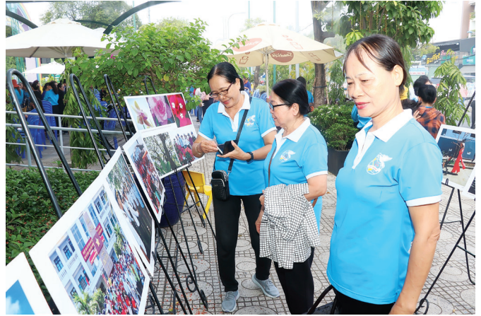
Người dân tham quan tại triển lãm.

Bên cạnh hoạt động triển lãm ảnh là chương trình giới thiệu sách và sinh hoạt chuyên đề, chủ đề “Biển đảo quê em” vào sáng ngày 24/8 với sự chia sẻ của Hội Luật gia