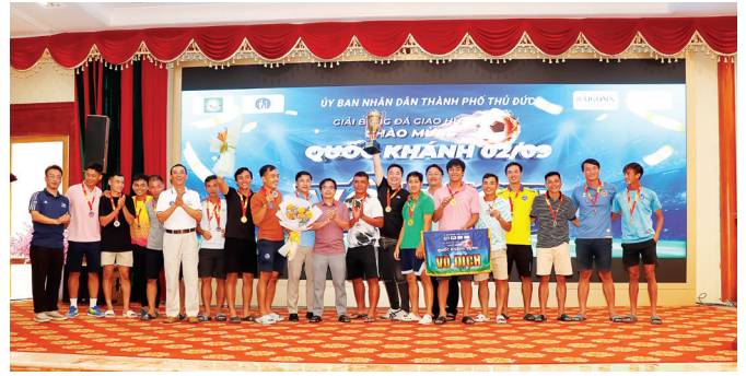
Ban Tổ chức trao cúp vô địch cho đội UBND TP Thủ Đức.