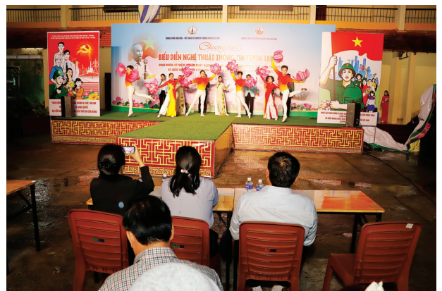
Tốp ca múa "Thành phố từng ngày đổi mới" do các ca sĩ Trung tâm Văn hóa TP Thủ Đức thể hiện.

Chương trình Thông tin lưu động kết hợp các tiết mục văn nghệ, tiêu phẩm tuyên truyền nhằm đa dạng hóa hình