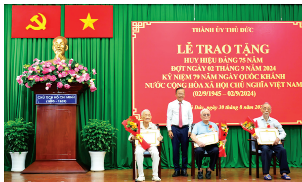
Đồng chí Nguyễn Hữu Hiệp, Bí thư Thành ủy Thủ Đức trao tặng Huy hiệu 75 năm tuổi Đảng đến các đồng chí đảng viên.

Phát biểu tại buổi lễ, đồng chí Nguyễn Hữu Hiệp, Bí thư Thành ủy Thủ Đức cho biết: đợt này, Đảng bộ TP Thủ Đức có 521 đảng viên được trao tặng Huy hiệu. Trong đó, có 2 đồng chí nhận Huy hiệu 80 năm tuổi Đảng; 4 đồng chí nhận Huy hiệu 75 năm tuổi Đảng; 13 đồng chí nhận Huy hiệu 65 năm tuổi Đảng; 24 đồng chí nhận Huy hiệu 60 năm tuổi Đảng; 65 đồng chí nhận Huy hiệu 55 năm tuổi Đảng; 72 đồng chí nhận Huy hiệu 50 năm tuổi Đảng; 108 đồng chí nhận Huy hiệu 45 năm tuổi Đảng; 167 đồng chí nhận Huy hiệu 40 năm tuổi Đảng và 66 đồng chí nhận Huy hiệu 30 năm tuổi Đảng. Đây là niềm vinh dự, tự hào chung của Đảng bộ TP Thủ Đức, của các đồng chí được nhận Huy hiệu. Sẽ là những cảm xúc khó tả, khó quên nhưng đồng thời cũng nhắc nhở từng đồng chí mình phải tiếp tục phấn đấu hơn nữa, rèn luyện nhiều hơn nữa dù đã gần tuổi nghỉ hưu hoặc vừa nghỉ hưu để tiếp tục cống hiến, không phụ lòng mong muốn của Đảng, của đồng chí, đồng đội và của gia đình. Đồng chí nhân mạnh, Huy hiệu Đảng là phần thưởng cao