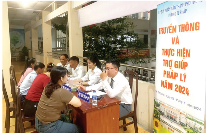
Quang cảnh buổi truyền thông và trợ giúp pháp lý tại hội trường UBND phường Bình Thọ.

Tại các buổi tuyên truyền, báo cáo viên đã tuyên truyền về những nội dung chính sách chăm lo đồng bào dân tộc của thành phố như: chính sách hỗ trợ lãi suất cho đồng bào dân tộc thiểu số có hoàn cảnh khó khăn trên địa bàn TP Hồ Chí Minh giai đoạn 2018-2025; chính sách hỗ trợ chi phí học tập đối với sinh viên người dân tộc thiểu số thuộc diện hộ nghèo và hộ cận nghèo giai đoạn 2021-2025. Đồng thời, tuyên truyền việc bảo tồn, phát huy giá trị truyền thống tốt đẹp, di sản văn hóa vật thể, phi vật thể các dân tộc thiểu số trên địa bàn thành phố (tiếng nói, chữ viết, trang phục, lễ hội của các dân tộc thiểu số, ẩm thực...); Nghị định số 08/2020/NĐ-CP ngày 08/01/2020 của Chính phủ về tổ chức và hoạt