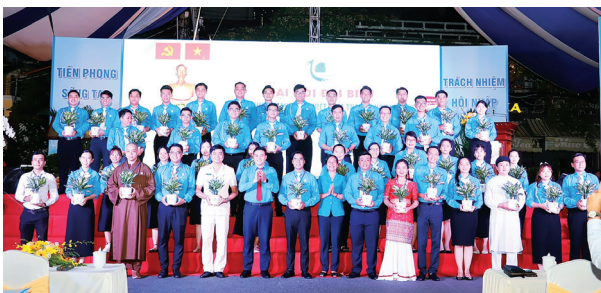
Ủy ban Hội LHTN Việt Nam TP Thủ Đức nhiệm kỳ 2024-2029 ra mắt Đại hội.

Nhiệm kỳ 2024-2029, Hội LHTN Việt Nam TP Thủ Đức đề ra khẩu hiệu hành động “Thanh niên TP Thủ Đức “Tiên phong - Sáng tạo - Trách nhiệm - Hội nhập”, Hội đã đề ra 9 chỉ tiêu trọng tâm: phấn đấu 90% hội viên, thanh niên được tiếp cận nâng cao năng lực số; hỗ trợ 1.000 ý tưởng, sáng kiến của thanh niên trở thành hiện thực; phát triển 10.000 hội viên mới, thành lập mới 75 chi Hội ngoài Nhà nước, CLB, đội, nhóm...