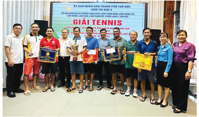
Lãnh đạo các phường trong Cụm thi đua 3 trao giải cho các đội đạt giải.

Hội thao là chuỗi hoạt động nhằm chào mừng kỷ niệm 79 năm Ngày Cách mạng tháng Tám thành công (19/8/1945-19/8/2024) và ngày Quốc khánh nước Cộng hòa Xã hội Chủ nghĩa Việt Nam (02/9/1945-02/9/2024) đồng thời, tạo điều kiện cho cán bộ, công chức, người lao