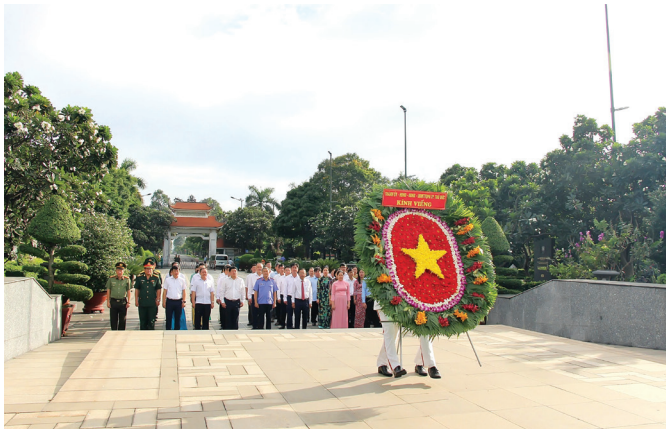
Đoàn 1: Đoàn đại biểu dâng hoa, dâng hương tại Nghĩa trang Thành phố - Lạc Cảnh, phường Linh Trung.

02/9/2024), sáng ngày 30/8, Thành ủy Thủ Đức đã tổ chức 04 đoàn dâng hương tưởng niệm Chủ tịch Hồ Chí Minh, các Anh hùng Liệt sĩ và Mẹ Việt Nam Anh hùng