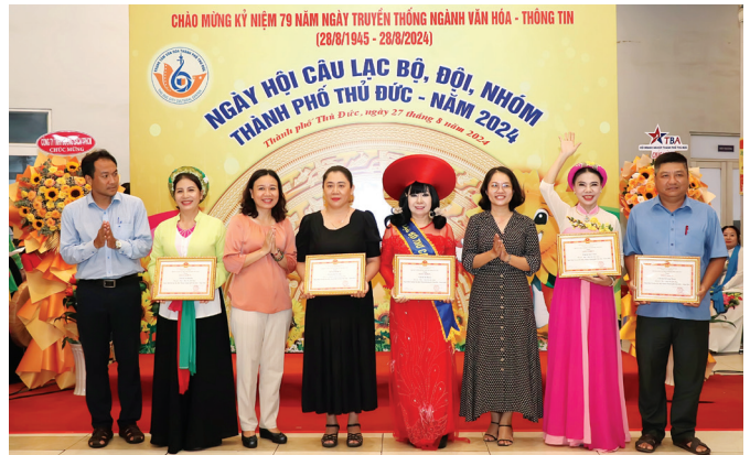
Các đồng chí lãnh đạo TP Hồ Chí Minh và lãnh đạo TP Thủ Đức trao giải Nhất, Nhì, Ba “Hội thi ẩm thực”.

Điểm nhấn của Ngày hội là chương trình giao lưu văn nghệ với chủ đề “Sắc màu văn hóa” với các nội dung ca ngợi Đảng, Bác Hồ kính yêu, ca ngợi những chiến công vẻ vang của lịch sử dân tộc; quê hương, đất nước, con người; ca ngợi TP Thủ Đức và những thành tựu trên các lĩnh vực trong thời kỳ Công nghiệp hóa - Hiện đại hóa đất nước nói chung và ca ngợi phát huy truyền thống của Ngành Văn hóa - Thông tin Việt Nam qua phần biểu diễn của 25 CLB, đội,