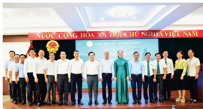
Lãnh đạo TP Hồ Chí Minh và TP Thủ Đức chụp hình lưu niệm tại hội nghị.

Thay mặt BTV Thành ủy Thủ Đức, đồng chí trân trọng ghi nhận những nỗ lực và cố gắng của cán bộ, công chức Trung tâm Hành Chính công TP Thủ Đức và mong muốn trong thời gian tới các đồng chí sẽ tiếp tục nỗ lực, phấn đấu, phát huy mạnh mẽ hơn nữa tinh thần đoàn kết, năng động, sáng tạo, dám nghĩ, dám làm, dám chịu trách nhiệm, tranh thủ mọi thời cơ, vượt qua thử thách đề tăng tốc cùng với Đảng bộ, Chính quyền TP Thủ Đức thực hiện thắng lợi các mục tiêu, nhiệm vụ đề ra trong năm 2024 và giai đoạn 2021-2025.