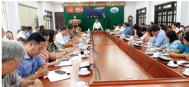
Đồng chí Nguyễn Hữu Hiệp, Bí thư Thành ủy Thủ Đức phát biểu kết luận tại buổi làm việc.

Tại buổi làm việc, Bí thư Đảng ủy 34 phường đã báo cáo cụ thể các địa chỉ nhà đất công theo 8 nhóm: Quỹ đất y tế, giáo dục, công viên cây xanh, công trình công cộng (trong các dự án đã tiếp nhận từ chủ đầu tư); quỹ đất y tế, giáo dục, công viên cây xanh, công trình công cộng (trong các dự án nhưng chưa tiếp nhận từ chủ đầu tư); đất nghĩa trang, nghĩa địa; đất có nguồn gốc do Nhà nước quản lý trong các khu dân cư (đang bị chiếm dụng); đất có nguồn gốc do nhà nước quản lý trong các khu dân cư hiện hữu (do UBND phường đang quản lý, sử dụng); đất có nguồn gốc do Nhà nước quản lý trong các dự án; quỹ đất nhận hoán đổi từ các chủ đầu tư; danh sách nhà đất thuộc phạm vi xử lý, sắp xếp theo Nghị định số 167/2017/NĐ-CP trên địa bàn các phường. Bên cạnh đó, Đảng ủy 34 phường đã tập trung thảo luận một số nội dung như: việc sử dụng một số vị trí đất có nguồn gốc do Nhà nước quản lý trong các khu dân cư hiện hữu để thực hiện công trình công ích, phục vụ cho nhu cầu sinh hoạt của cộng đồng dân cư trên