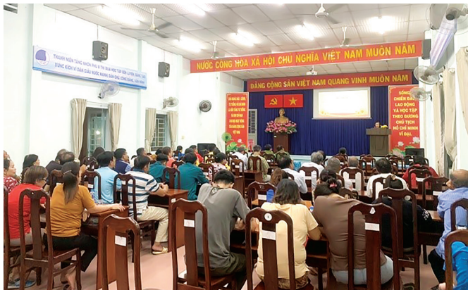
Buổi truyền thông và trợ giúp pháp lý tại hội trường UBND phường Tăng Nhơn Phú B.