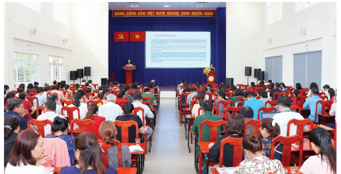
Quang cảnh tại buổi tập huấn.

Trong đó, nhấn mạnh các nhiệm vụ giải pháp như: Bổ