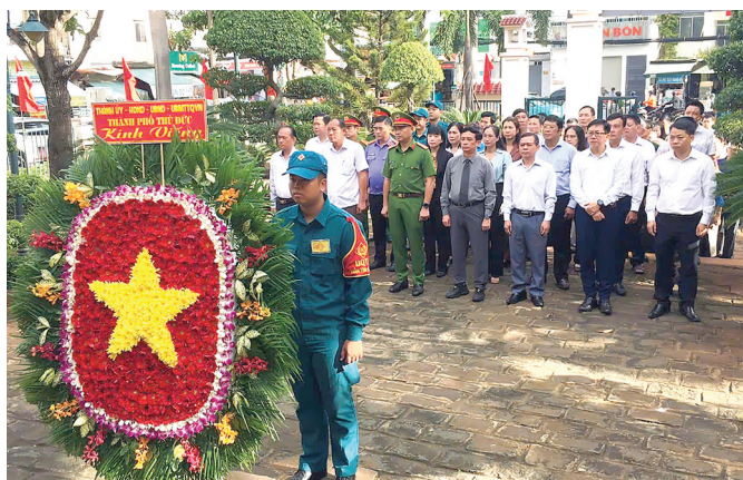
Đoàn 4: Đoàn đại biểu dâng hoa, dâng hương tại Đền tưởng niệm Anh hùng Liệt sĩ Bình Trưng, phường Bình Trưng Tây.