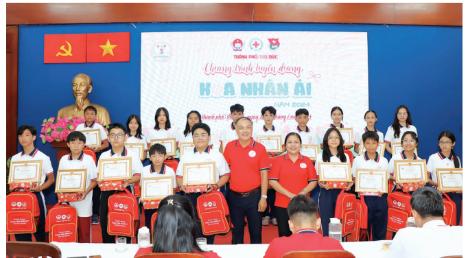
Các gương điển hình “Hoa nhân ái” năm học 2023-2024 được tuyên dương khen thưởng tại chương trình.