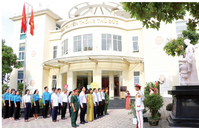
Đoàn 3: Đoàn đại biểu dâng hoa, dâng hương tại Nhà Truyền thống - Nhà bia ghi danh Liệt sĩ Thủ Đức, phường Linh Chiểu.