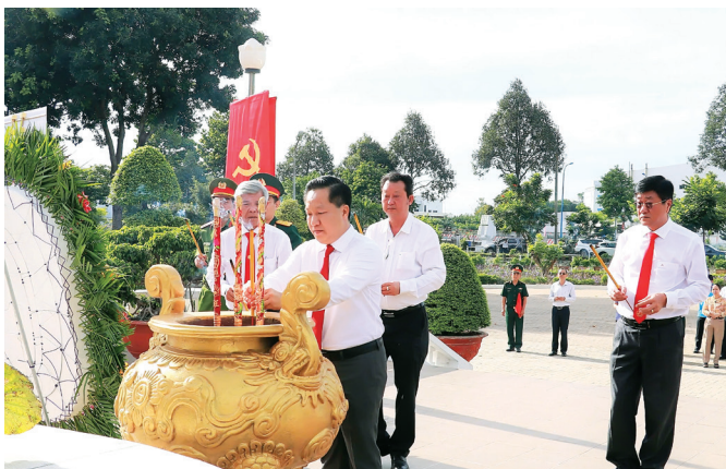
Đoàn 2: Đoàn đại biểu dâng hoa, dâng hương tại Đền tưởng niệm Bến Nọc, phường Tăng Nhơn Phú A.