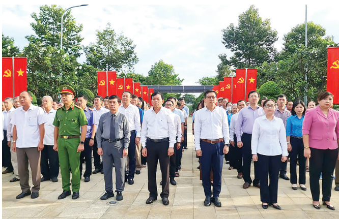
Đoàn 4: Đoàn đại biểu viếng Bia tưởng niệm các anh hùng Liệt sĩ chiến đấu bảo vệ Cầu Rạch Chiếc, phường An Phú.