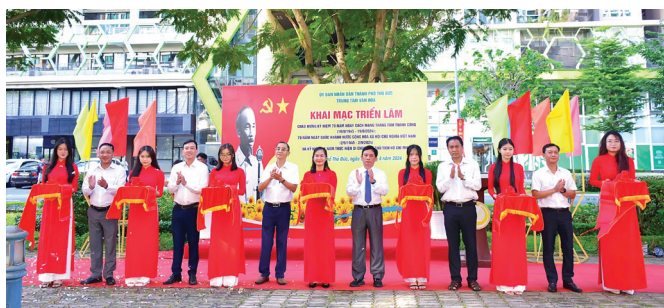
Các đại biểu cắt băng khai mạc triển lãm ảnh.

Triển lãm trưng bày 180 ảnh cố định trên 15 tấm pano 2 mặt kích thước (3m x 2m) với các chủ đề: “Di chúc thiêng