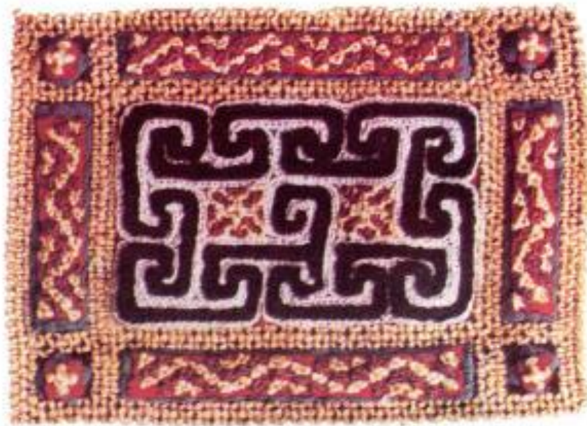
Hình 3. Thổ cẩm của dân tộc Hmông