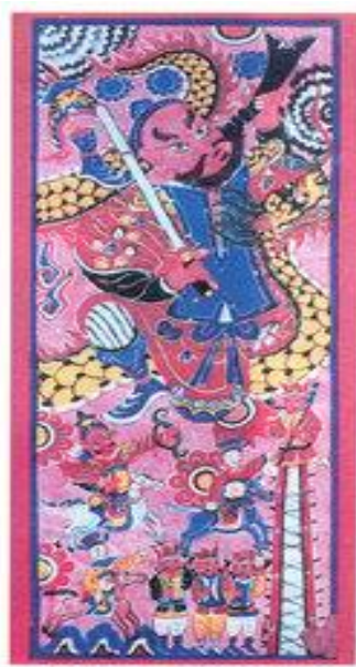
Hình 1. Tranh thờ của dân tộc Dao

- Đồng bào các dân tộc ít người (Tày, Nùng, Thái, Dao, Sán Chay, Hmông, Gia-rai, Ê-đê, Chăm,...) rất chú ý đến trang trí trên y phục. Dù là trên chiếc khăn “Piêu”, vỏ chăn, cặp váy hay những phần thêu ở áo dài, dây lưng... đều có những mẫu trang trí vừa thanh nhã, vừa đẹp, phù hợp với từng vật dụng.