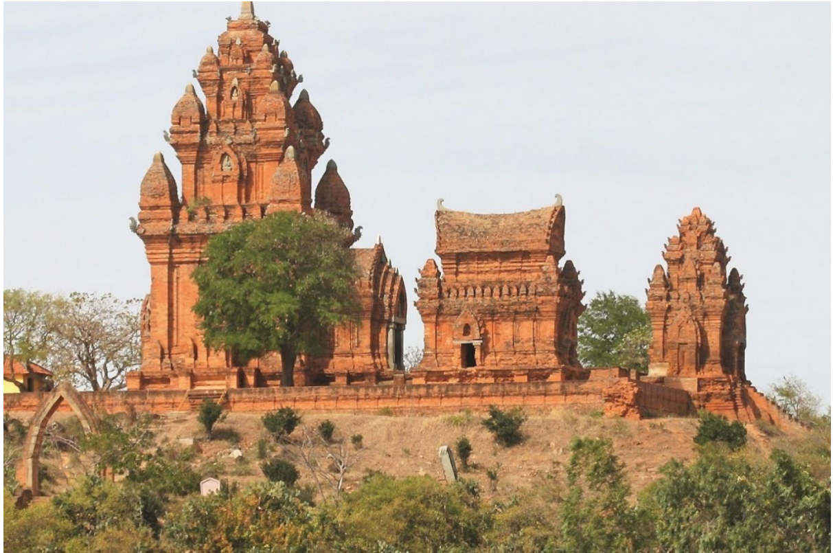
Tháp Chăm (Ninh Thuận)