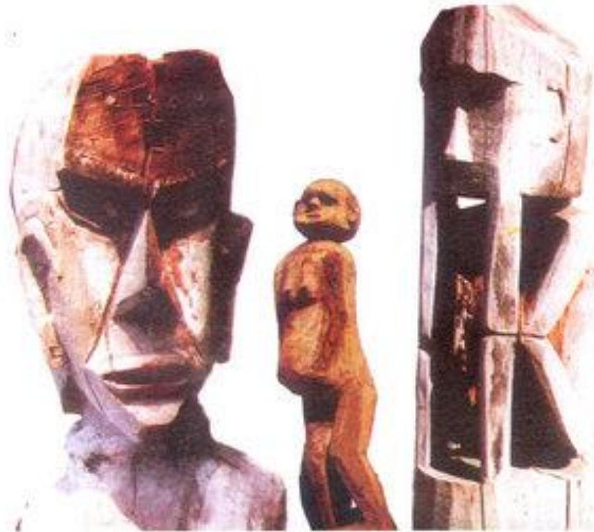
Hình 5. Tượng nhà mồ của dân tộc Ba-na (Gia Lai, Tây Nguyên)