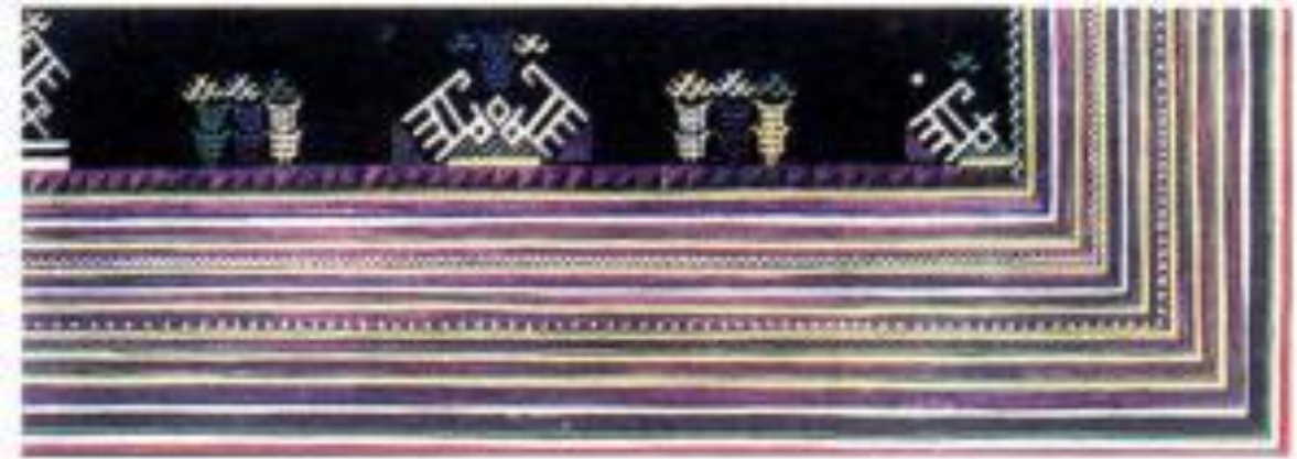
Hình 2. Gấu áo, thêu thoáng ghép vải có hình chó của dân tộc Dao