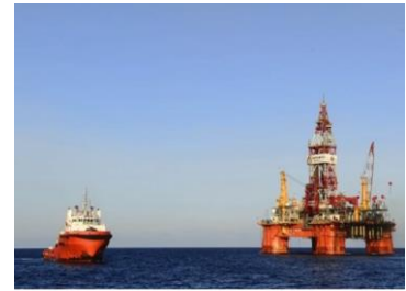
Trung Quốc đặt giàn khoan Hải Dương 981 tại vị trí quần đảo Hoàng sa.