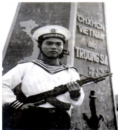
Chiến sĩ hải quân canh giữ đảo

* Nhiệm vụ : Quan sát ảnh và trả lời câu hỏi