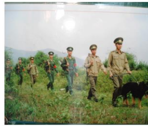
Bộ đội biên phòng đang đi tuần tra biên giới