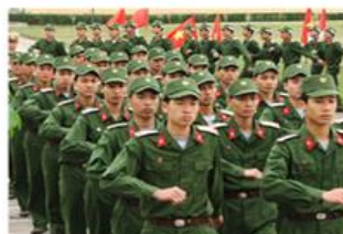
Bộ đội đang duyệt binh