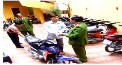
Công an giúp người dân lấy lại tài sản bị mất cắp