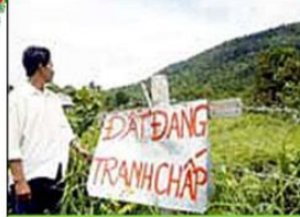
TRANH CHẤP ĐẤT