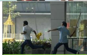
CÓ Ý GÂY THƯƠNG TÍCH