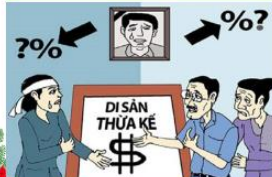
TRANH CHẤP QUYỀN THỪA KẾ