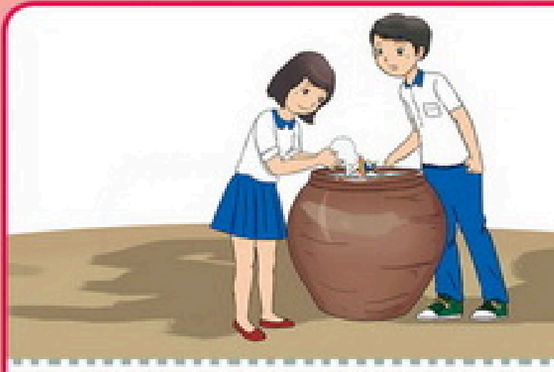
4 Thả cá hoặc thả Mesocyclops (Mê-dô-xi) để diệt bọ gậy/lăng quăng