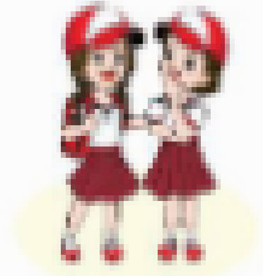
c. trò chuyện