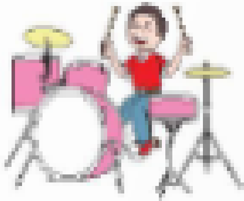
a. đánh trống

1. Hoạt động nào trong mỗi hình sau có thể phát ra âm thanh cao?