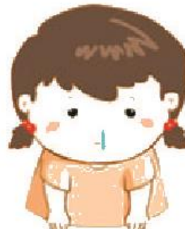
Chảy nước mũi