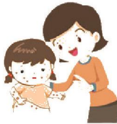
Tiếp xúc với người mắc bệnh