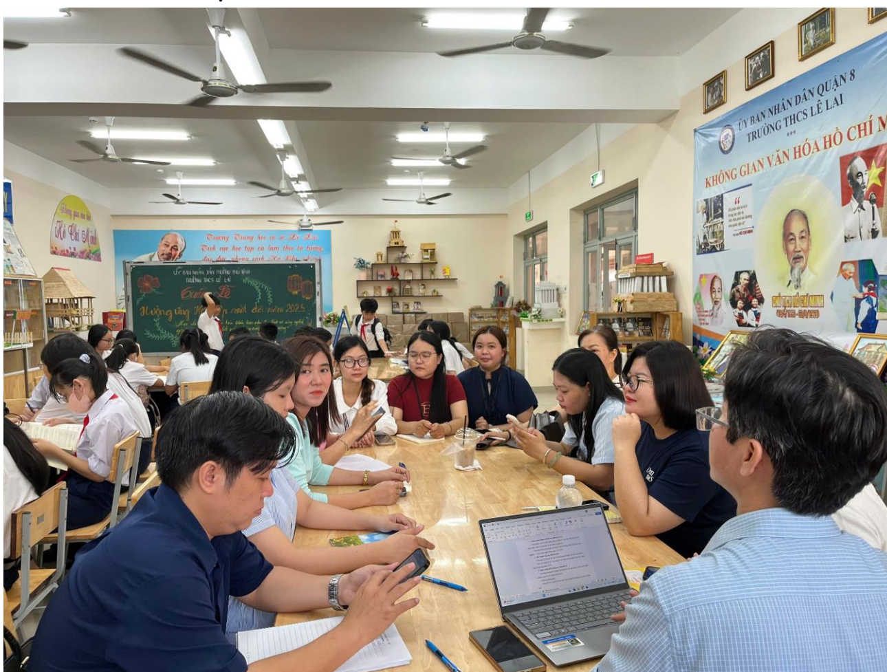
Hình ảnh thầy cô tổ Ngữ văn nhà trường cùng tham gia chia sẻ góc giao lưu bạn đọc

Đặc biệt, trong ngày 5/10/2025, Thư viện tổ chức “Góc giao lưu bạn đọc” – nơi các nhóm học sinh cùng thảo luận, trao đổi về các cuốn sách yêu thích, kể chuyện sách và chia sẻ bài học rút ra cho bản thân.