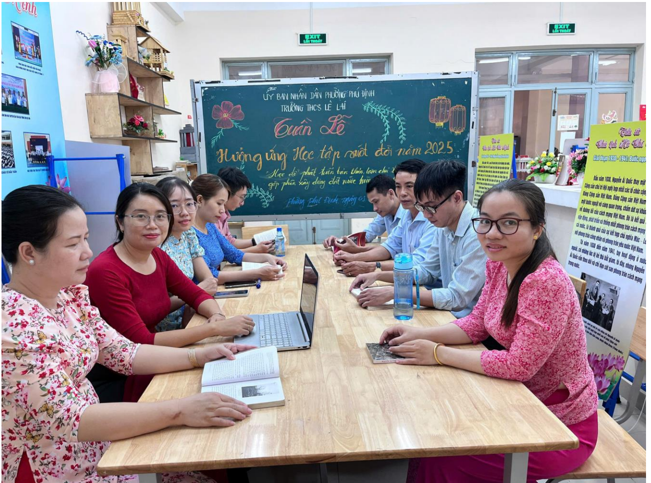
Hình ảnh thầy cô tổ KHTN cùng tham gia Tuần lễ hưởng ứng Học tập suốt đời năm 2025

Tuần lễ hưởng ứng học tập suốt đời năm 2025 khép lại nhưng dư âm và ý nghĩa của nó vẫn lan tỏa mạnh mẽ trong toàn thể học sinh, giáo viên Trường THCS Lê Lai. Thư viện nhà trường sẽ tiếp tục duy trì các hoạt động đọc sách định kỳ, mở rộng kho sách, ứng dụng công nghệ số trong quản lý và tra cứu tài liệu, từng bước xây dựng thư viện thân thiện – hiện đại – mở, phục vụ tốt hơn nhu cầu học tập và phát triển của học sinh.