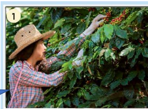
Trồng cà phê