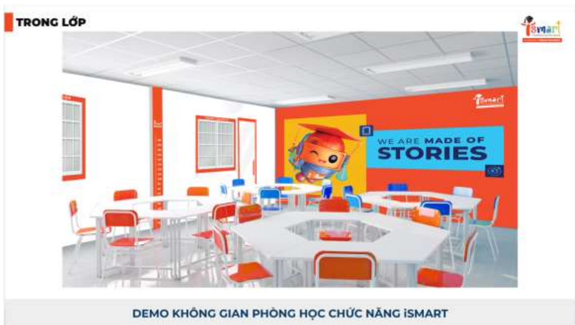
Hình ảnh phòng học thông minh iSMART