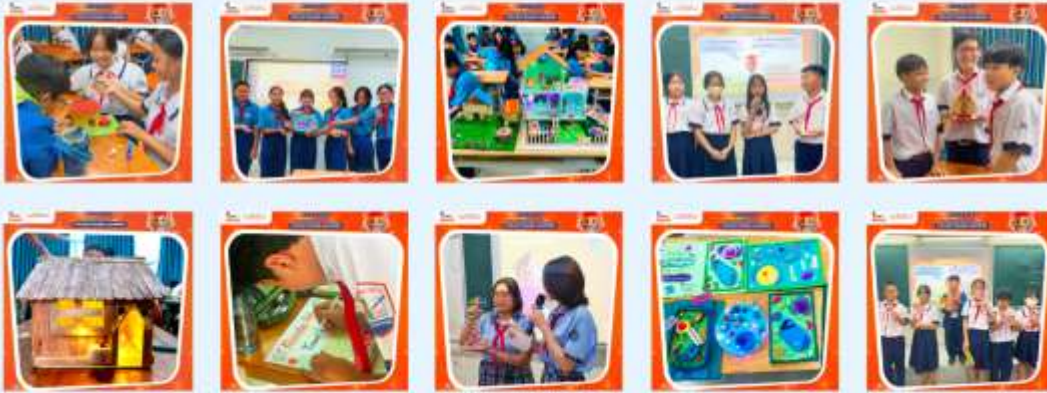
Hình ảnh lớp học dự án- Project Based Learning