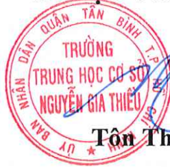
Tôn Thất Nhân Hiếu