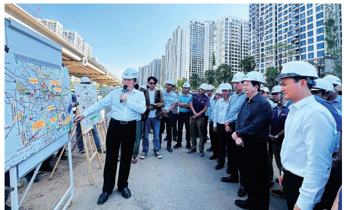
Phó Thủ tướng Chính phủ Mai Văn Chính (thứ 2 hàng thứ nhất từ phải sang) kiểm tra, nghe báo cáo tình hình thực hiện dự án tại gói thầu XL3, đoạn qua khu đô thị Vinhomes Grand Park trên địa bàn TP Thủ Đức.

Theo chủ đầu tư, khó khăn lớn nhất của dự án hiện nay