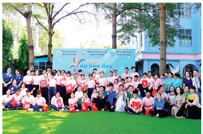
Ban tổ chức trao tặng quà đến các em học sinh tham gia ngày hội.