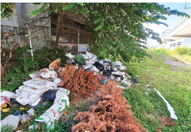
Ảnh chụp tại cầu Rạch Chiếc, phường An Phú ngày 11/3/2025.