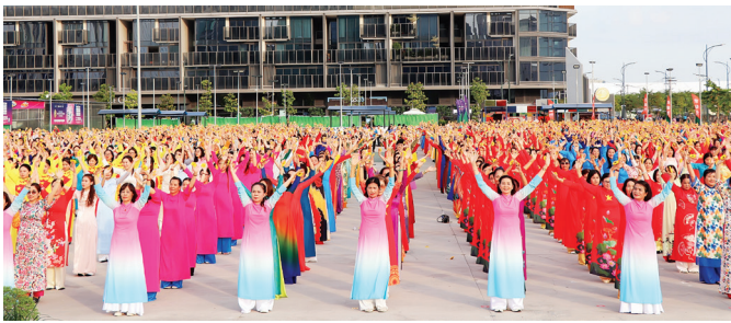
Hơn 3.000 đại biểu tham gia Tiết mục “Đồng diễn dân vũ với Áo dài” với chủ đề “50 năm - Tự hào một dải gấm hoa”.

Phát biểu chúc mừng, đồng chí Trần Hữu Phước, Phó Chủ tịch UBND TP Thủ Đức ghi nhận, đánh giá cao những đóng góp to lớn của Hội LHPN TP Thủ Đức trong những năm qua. Hội đã không ngừng đổi mới nội dung và phương thức hoạt động, vừa chăm lo, bảo vệ quyền lợi của phụ nữ, vừa vận động, tập hợp các tầng lớp phụ nữ tham gia phong trào thi đua yêu nước, tham gia phát triển kinh tế - xã hội, xây dựng gia đình hạnh phúc. Đồng chí mong muốn trong thời gian tới, BTV Hội LHPN TP Thủ Đức tiếp tục phát huy vai trò tham mưu cho các Cấp ủy trong công tác đổi mới nội dung, phương thức hoạt động Hội và phong trào phụ nữ, quan tâm động viên nữ cán bộ trẻ ra sức học tập, nâng cao trình độ kiến thức, phẩm chất chính trị,