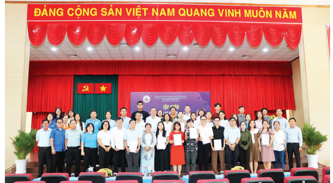
Các đại biểu cùng học viên chụp hình lưu niệm tại buổi tập huấn.