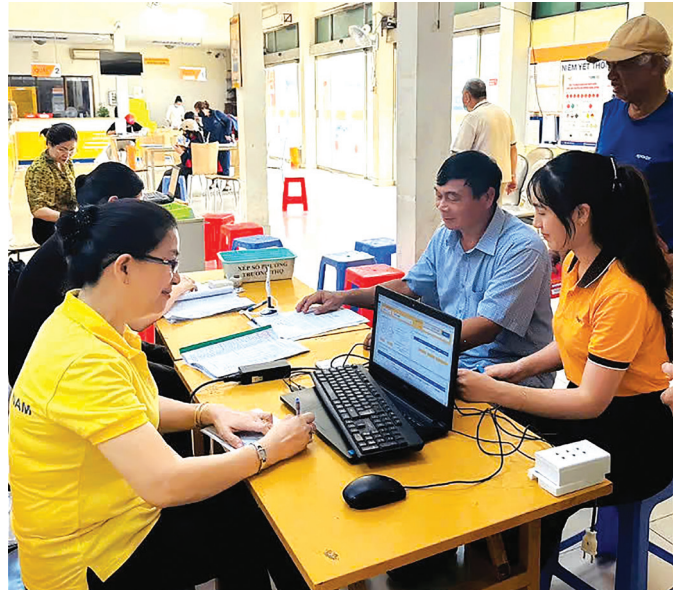
Nhân viên ngân hàng Liên Việt hướng dẫn người hưởng lương hưu mở tài khoản nhận lương hưu, trợ cấp BHXH tại điểm chi.

Đối với công tác chi trả lương hưu, trợ cấp BHXH hàng tháng, BHXH TP Hồ Chí Minh thực hiện chi trả qua tài khoản cho người hưởng từ ngày 01 hàng tháng; chi bằng tiền mặt tại các điểm chi và Bưu điện Trung tâm từ ngày 7 đến hết ngày 25 hàng tháng (lưu ý: trường hợp ngày chi trả trùng vào ngày thứ Bảy, Chủ nhật, ngày lễ Tết thì ngày chi trả là ngày làm việc tiếp theo). Tại địa bàn TP Thủ Đức, số lượng người nhận lương hưu,