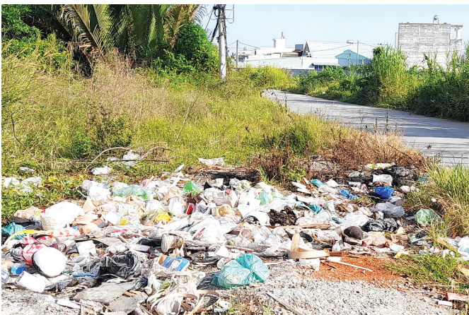
Ảnh chụp tại đường Trường Lưu, phường Long Trường ngày 11/3/2025.