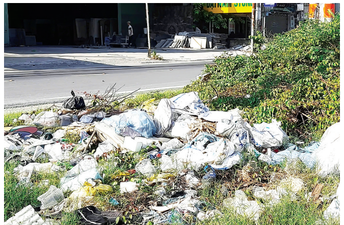
Ảnh chụp tại đường Nguyễn Duy Trinh, phường Phú Hữu ngày 11/3/2025.