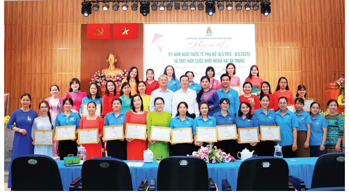
Các đại biểu chụp hình lưu niệm cùng các đơn vị đạt giải hội thi “Tạo Slogan ấn tượng”.