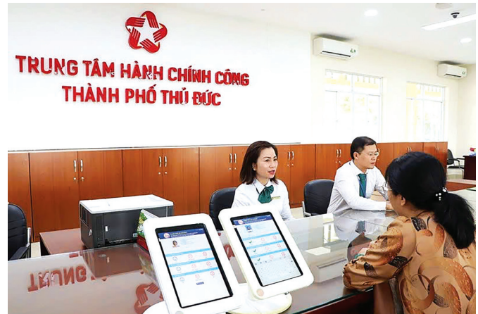
Người dân thực hiện các thủ tục hành chính tại Trung tâm Hành chính công TP Thủ Đức.

Đối với chỉ số CCHC cấp tỉnh được cấu trúc thành 8 lĩnh vực đánh giá, 43 tiêu chí, 102 tiêu chí thành phần cụ thể: Công tác chỉ đạo, điều hành CCHC: 6 tiêu chí và