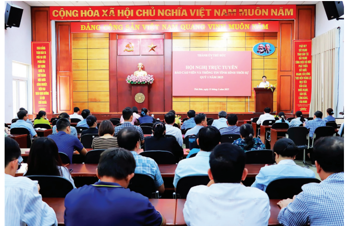
Quang cảnh hội nghị tại điểm cầu Thành ủy Thủ Đức.