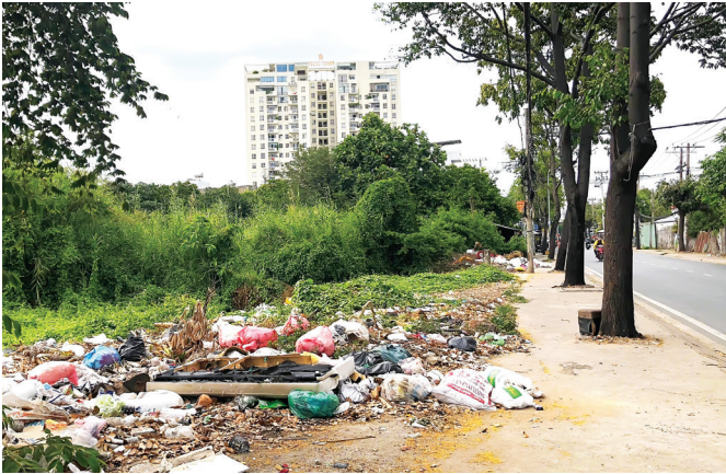
Ảnh chụp tại đường Linh Đông, phường Linh Đông ngày 10/3/2025.