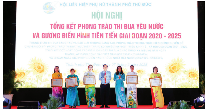
Ban tổ chức trao bằng khen của Trung ương Hội LHPN Việt Nam cho các tập thể có thành tích xuất sắc tiêu biểu trong thực hiện phong trào thi đua và nhiệm vụ công tác Hội năm 2024.