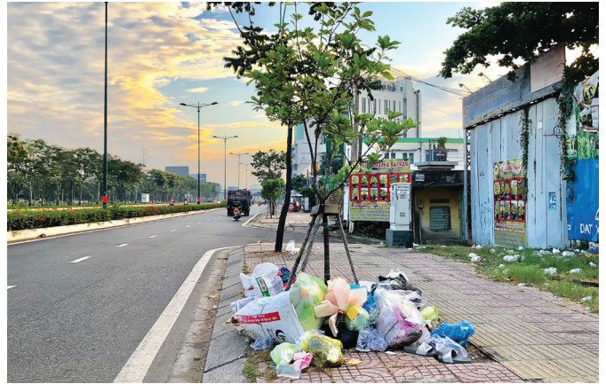
Ảnh chụp tại đường Phạm Văn Đồng, phường Hiệp Bình Chánh ngày 11/3/2025.