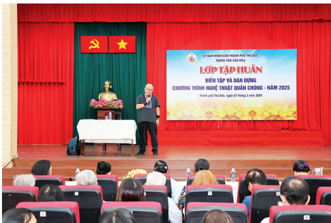
Quang cảnh buổi tập huấn.