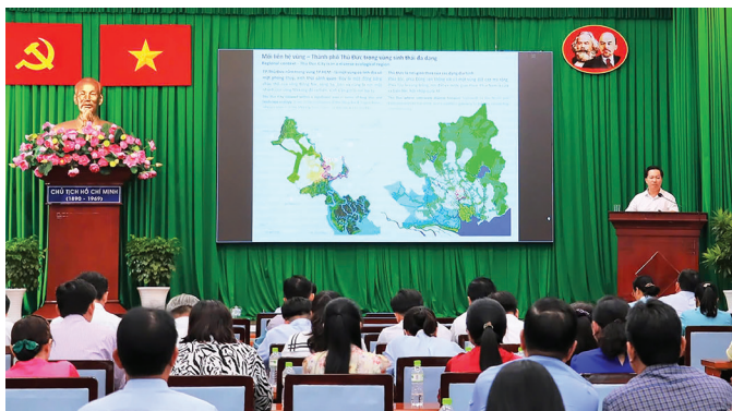
Quang cảnh hội nghị.