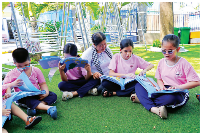
Các em học sinh tham gia đọc sách chữ nổi.

Dịp này, các em học sinh tại Trung tâm Bảo trợ khiếm thị Nhật Hồng cũng được nghe tuyên truyền về Luật An