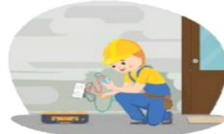
Lắp đặt hệ thống điện, nước