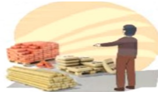
Chọn vật liệu