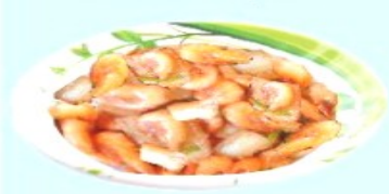
Tôm rang thịt ba chỉ

Câu 2: (2,0 điểm) Quan sát những món ăn dưới đây, em hãy cho biết mỗi món ăn cung cấp chất dinh dưỡng nào là chủ yếu.