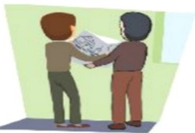
Làm việc với kiến trúc sư