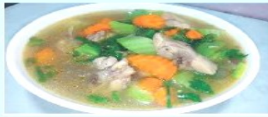
Canh cà rốt, su su nấu sườn lợn