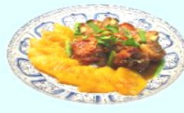
Sườn lợn kho dứa