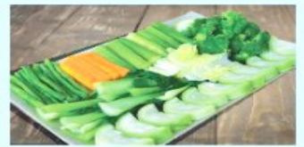
Rau, củ luộc