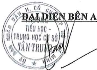
NGUYỄN VĂN QUÍ

- Hợp đồng này gồm 4 trang được lập thành 04(bốn) bản mỗi bên giữ 02 (hai) bản có giá trị như nhau. Hợp đồng này có hiệu lực kể từ ngày ký.