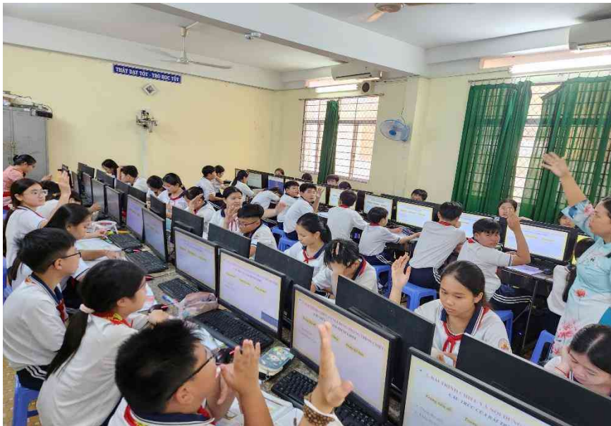
Hình 3. Các nhóm xung phong trình bày bài.