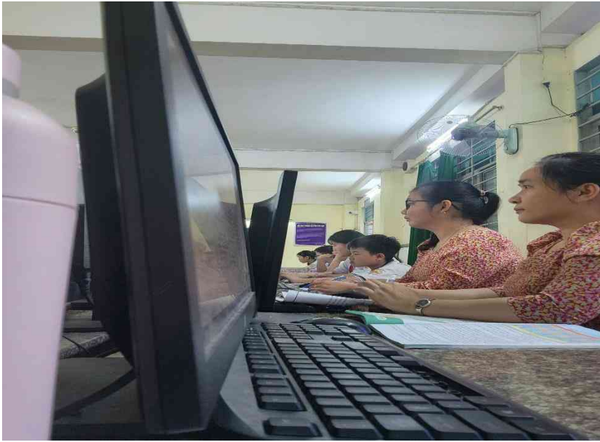
Hình 4. Giáo viên chăm chú quan sát học sinh trình bày.