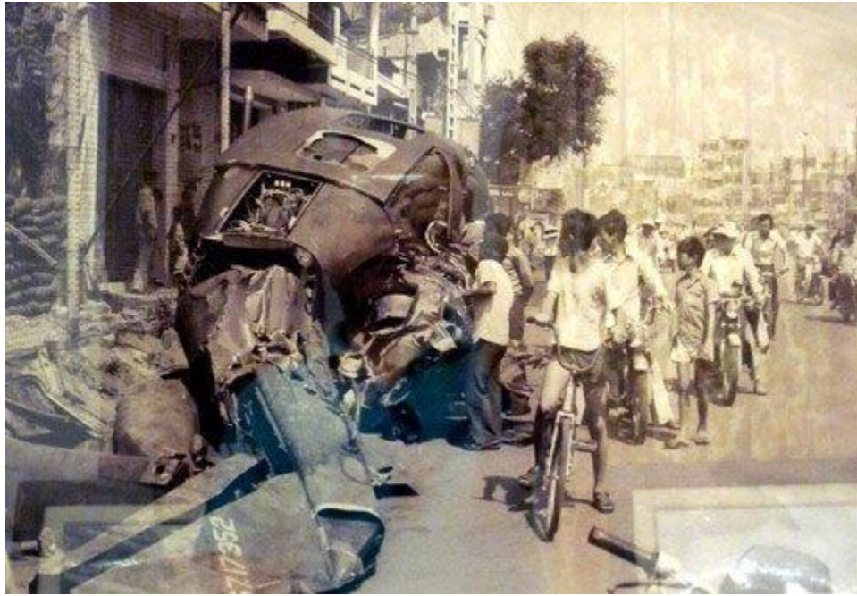
Máy bay lên thẳng của Mỹ bị bắn rơi trên đường phố Sài Gòn