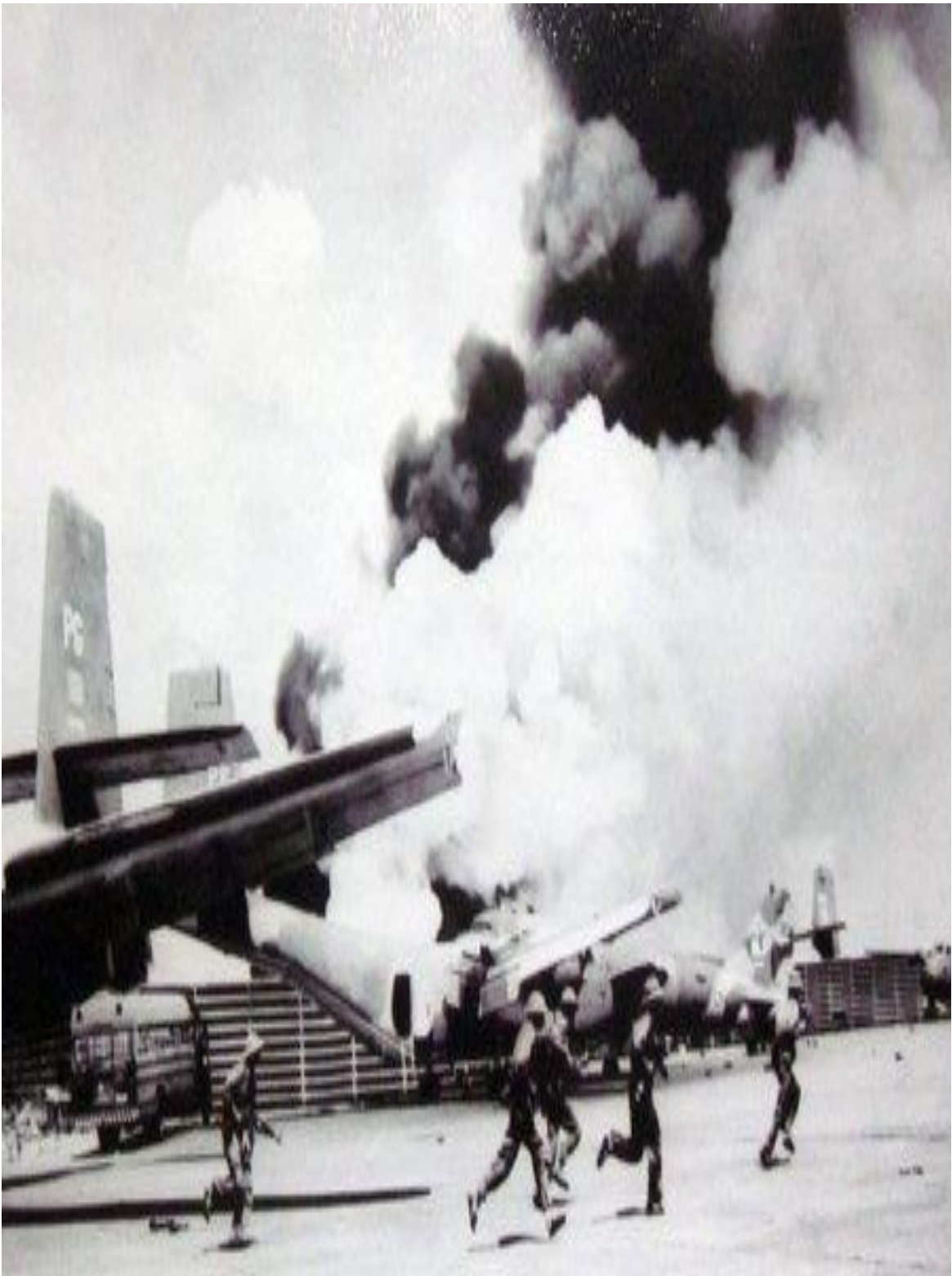
Quân giải phóng đánh sân bay Tân Sơn Nhất ngày 30/4/1975.