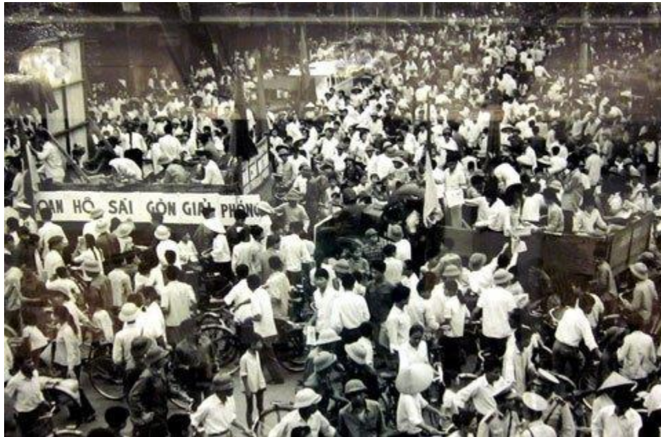
Hàng chục vạn nhân dân thủ đô Hà Nội đổ ra đường mừng thắng lợi vĩ đại của dân tộc

Chúng cùng nhau tham khảo những quyển sách dưới (hiện có tại thư viện trường) để tìm hiểu thêm về lịch sử của dân tộc ta