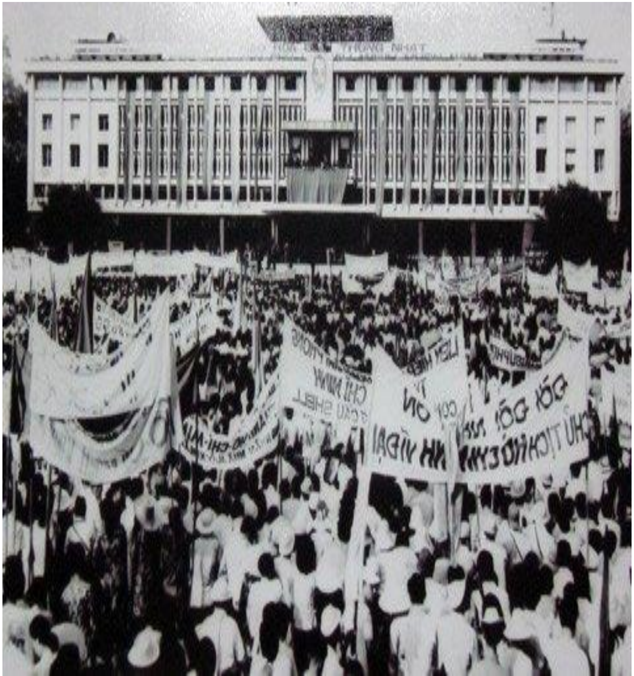
Các tầng lớp nhân dân Sài Gòn tham dự mít tinh mừng chiến thắng