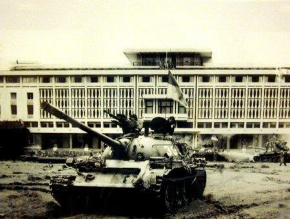
Xe tăng quân giải phóng đánh chiếm phủ tổng thống ngụy lúc 9g30 ngày 30/4/1975

Chúng ta cùng nhìn lại một số hình ảnh làm nên chiến thắng chiến dịch Hồ Chí Minh lịch sử