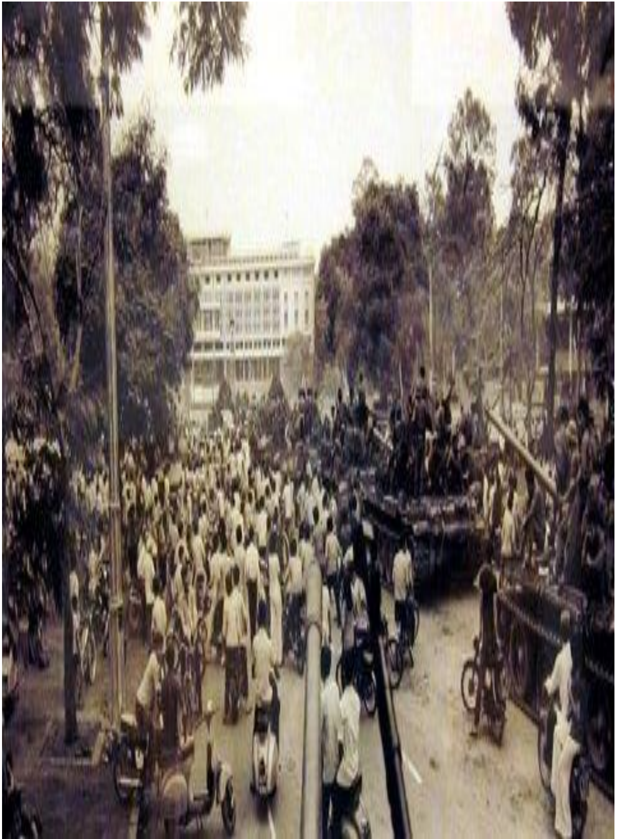
Nhân dân vui mừng chứng kiến đoàn xe tăng tiến vào dinh Độc Lập.