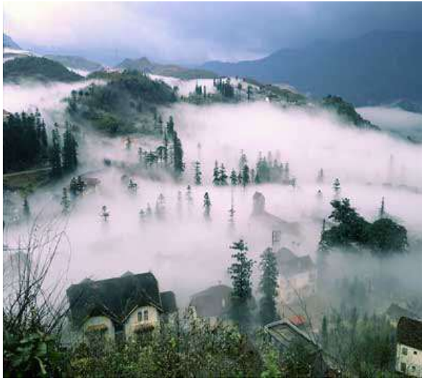
Sapa - Lào Cai.