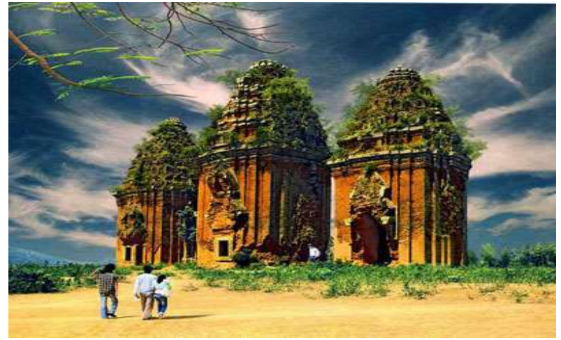
Tháp Chăm – Ninh Thuận.