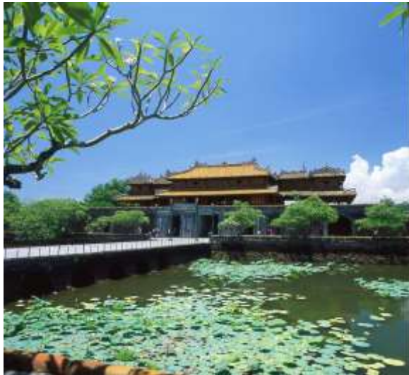
Kinh Thành Huế.