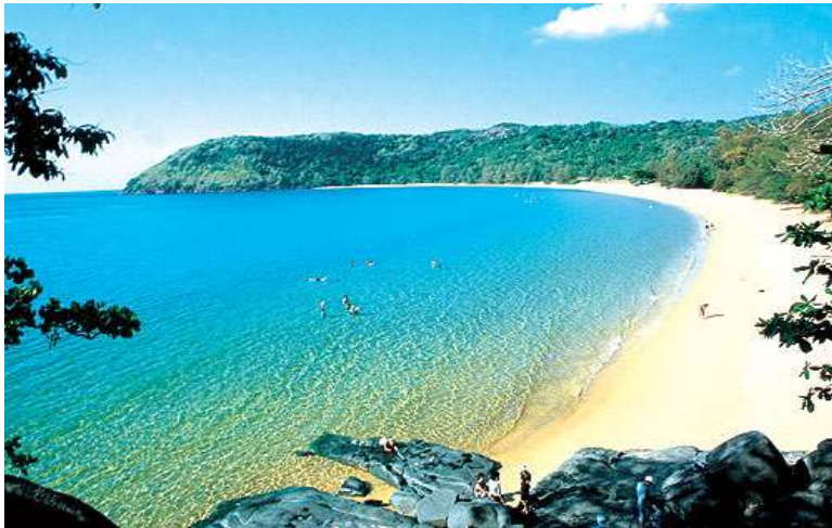
Biển Vũng Tàu.