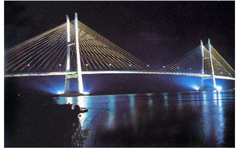
Cầu Mỹ Thuận.