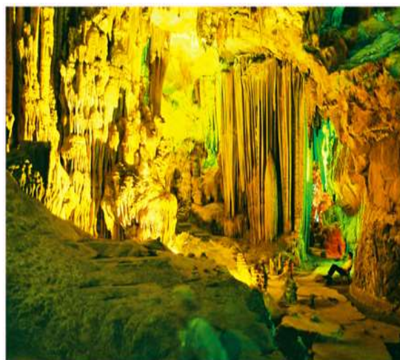
Phong Nha Kẻ Bàng - Quảng Bình.