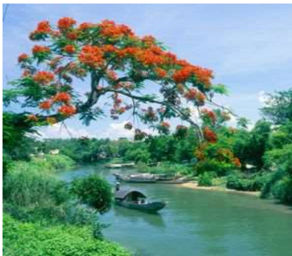
Sông Hương – Huế.