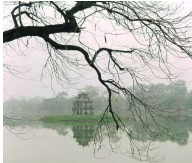
Tháp Rùa – Hà Nội.