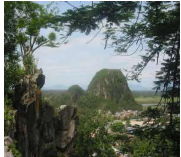
Ngũ Hành Sơn - Đà Nẵng.