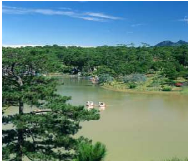
Hồ Than Thở - Đà Lạt.