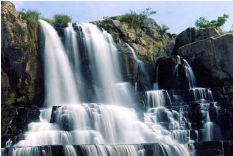
Tháp Cam Ly – Đà Lạt.