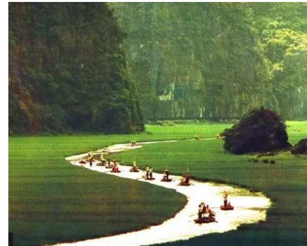
Làng quê – Bắc bộ.