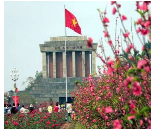
Lăng Bác – Hà Nội.