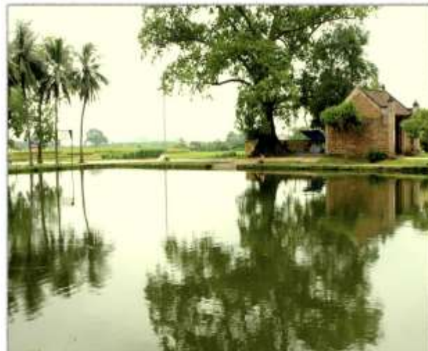
Làng quê – Bắc bộ.