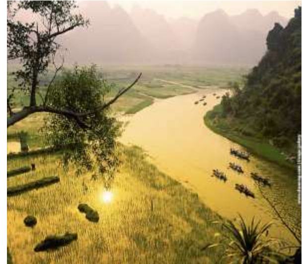
Chùa Hương - Hà Tây.