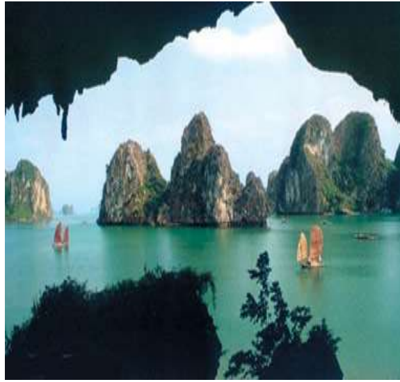
Vịnh Hạ Long-Quảng Ninh.