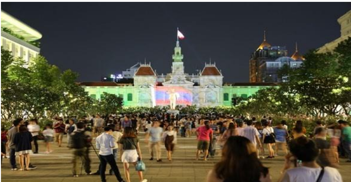
Hình 2. Thành phố Hồ Chí Minh – nơi tập hợp nhiều dân tộc và người dân đến từ nhiều vùng miền khác nhau

Trải qua quá trình hình thành và phát triển, Thành phố Hồ Chí Minh tập hợp nhiều người dân đến từ nhiều vùng miền khác nhau, dẫn đến sự giao thoa về mặt văn hoá, kinh tế và ngôn ngữ. Người dân từ các miền đất khác mang những nét ngôn ngữ đặc trưng của địa phương đến đây học tập và làm việc, những sắc màu ngôn ngữ này dung hoà cùng ngôn ngữ bản địa, tạo ra nét đẹp riêng: thanh thanh, sang sảng, ngọt ngào, mộc mạc và khí khái. Quá trình ấy chưa từng dừng lại, ngôn ngữ ở Thành phố Hồ Chí Minh vẫn tiếp tục thể hiện sự đa dạng và dung hợp với những ngôn ngữ từ nơi khác đến.