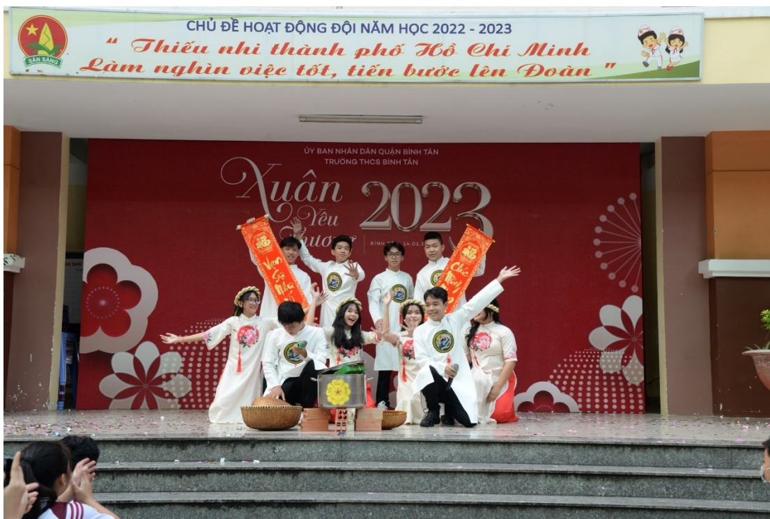
Tiết mục “Tết đông đầy” của tập thể lớp 9/13.

Điểm đặc biệt trong chương trình văn nghệ hội xuân năm nay, chính là sự liên kết giữa các lớp và các khối lớp trong nhà trường, được các em đầu tư hoành tráng. Chính những điều đó, làm cho tinh thần đoàn kết, giao lưu học hỏi trong nhà trường ngày được củng cố và nâng lên một tầm cao mới. Những tràng vỗ tay nhiệt tình, tiếng cười rộn rã của mọi người đã làm bầu không khí trở nên tung bừng, nhộn nhịp hơn.