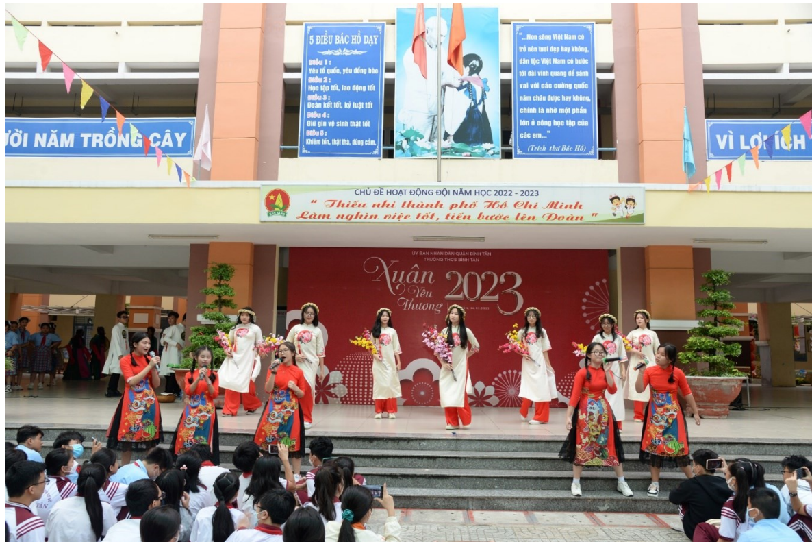
Tiết mục “Như hoa mùa xuân” được trình diễn bởi sự kết hợp của các lớp: 7/1 – 7/2 – 8/5 – 9/13. Tiết mục nhảy hiện đại “Cô ba Sài Gòn” được trình bởi sự kết hợp của lớp: 9/4 – 9/5 – 9/10 – 9/14.