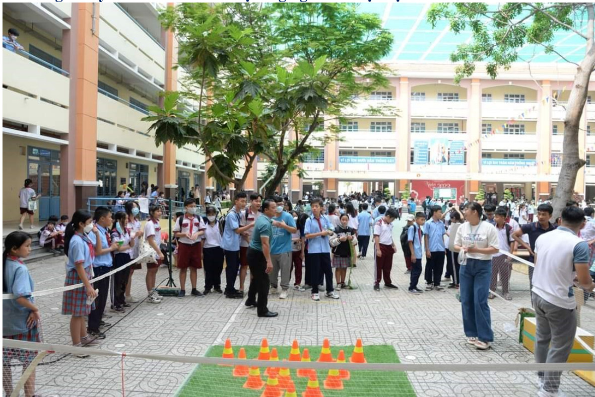
Học sinh tham gia trò chơi “Chiếc vòng thần kỳ”. Luật chơi: Dùng tay đưa chiếc vòng vào những trụ mà ban tổ chức đã chuẩn bị.