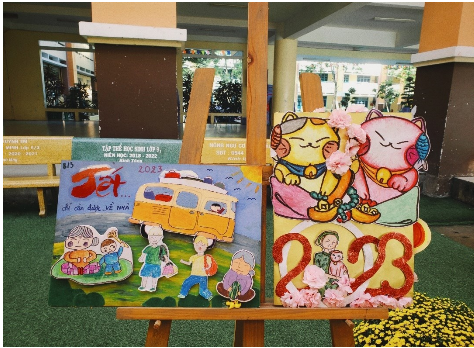
Thiệp chúc xuân của lớp 9/1 (phải) đạt giải nhất và lớp 8/3 (trái) đạt giải nhì trong hội thi thiết kế “Thiệp chúc Xuân”.