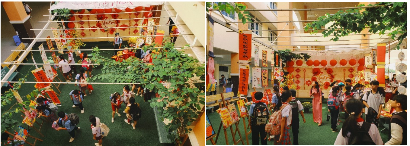
Học sinh nhà trường tham quan tiểu cảnh xuân trong giờ ra chơi hằng ngày.

Hoạt động tiếp theo để chuẩn bị cho Hội xuân là hoạt động thi “Viết câu đối” và “Thiết kế thiệp chúc xuân”. Qua bàn tay khéo léo, tỉ mỉ của mình, các “nghệ nhân nhí” đã tạo ra rất nhiều tác phẩm rất công phu, thật đẹp điểm tô thêm cho tiểu cảnh Xuân thật đặc biệt hơn.