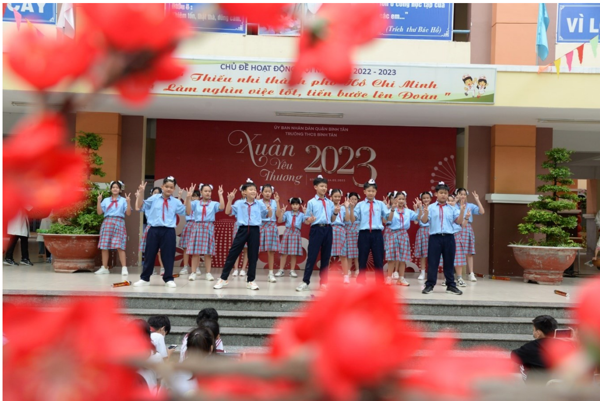
Tiết mục nhày hiện đại “Nụ cười 18 – 20” của tập thể lớp 6/1. Mặc dù là “em út” trong trường nhưng không thể phủ nhận tài năng của các bạn, động tác rất đồng đều. Đặc biệt, động tác lắc eo đã làm cho cả sân trường reo hò và vỗ tay rất lớn.