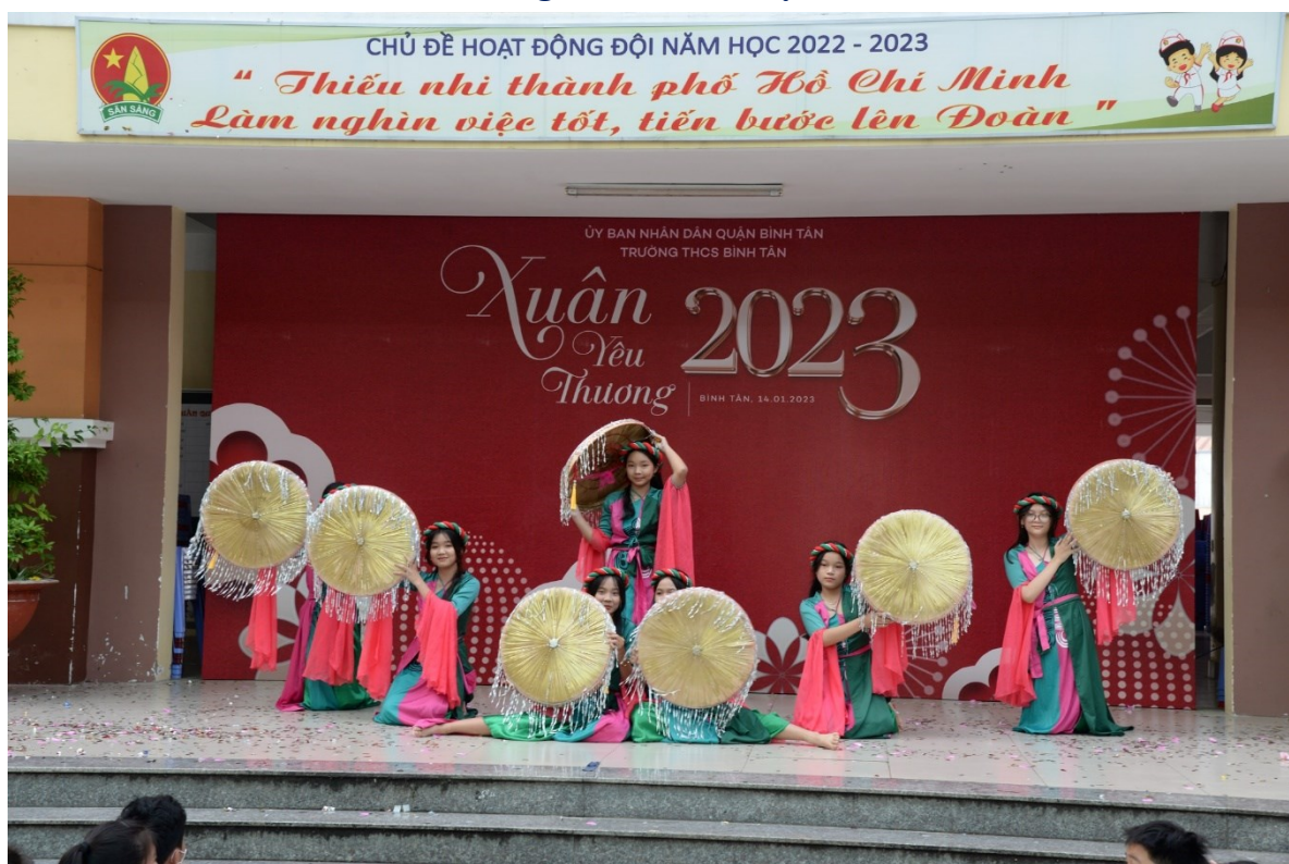
Tiết mục múa đương đại “Tát nước đầu đình” của tập thể lớp 7/9. Hình ảnh “nón quai thao”; “áo tứ thân” đã là một trong những điểm nhấn của hương vị Tết ở miền Bắc Việt Nam chúng ta trong những lễ hội hay dịp đi Khai xuân của mọi người.