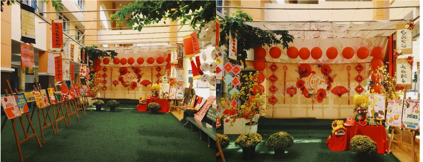
Tiểu cảnh mang tên “Không gian sắc xuân” của Trường THCS Bình Tân.

Trước khi bắt đầu Hội Xuân, đã có rất nhiều những hoạt động được diễn ra. Điểm nổi bật nhất, điều chưa từng xảy ra trong hơn 11 năm qua của Trường THCS Bình Tân, chính là phần dựng Tiểu cảnh xuân do hai thầy cô Mỹ thuật nhà trường thực hiện. Chính việc dựng tiểu cảnh này đã làm cho không khí đón Tết trong nhà trường trở nên nhộn nhịp hơn cũng như mang đến một bầu không khí rộn ràng, vui tươi của mùa xuân và làm thay đổi cả một giờ ra chơi bình thường của các bạn học sinh. “Góc xuân” nô nức “khách” đến thưởng lãm. Từ thầy cô đến học trò đều rất hào hứng chụp hình kỷ niệm bộ ảnh Xuân cho riêng mình.