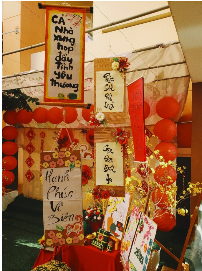
Câu đối Tết của lớp 7/5 (chính giữa) đạt giải nhất trong hội thi “Viết câu đối”.