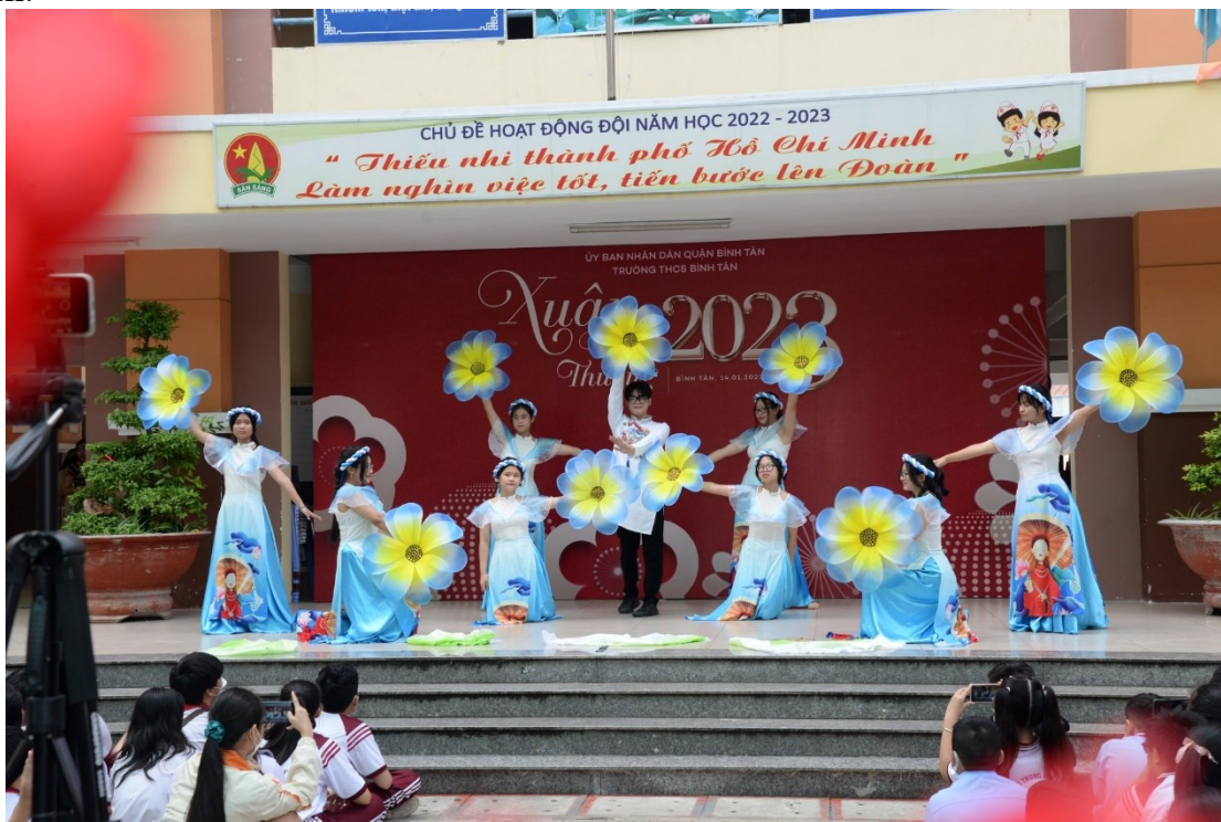
Tiết mục múa “Xuân đẹp làm sao” của tập thể lớp 8/13.

Đi vào hoạt động chính thức của chương trình Hội xuân của nhà trường chính là các tiết mục văn nghệ “Cây nhà lá vườn” của những nghệ sĩ mang đến cho mọi người sự tươi mới, bầu không khí rộn ràng đón xuân.