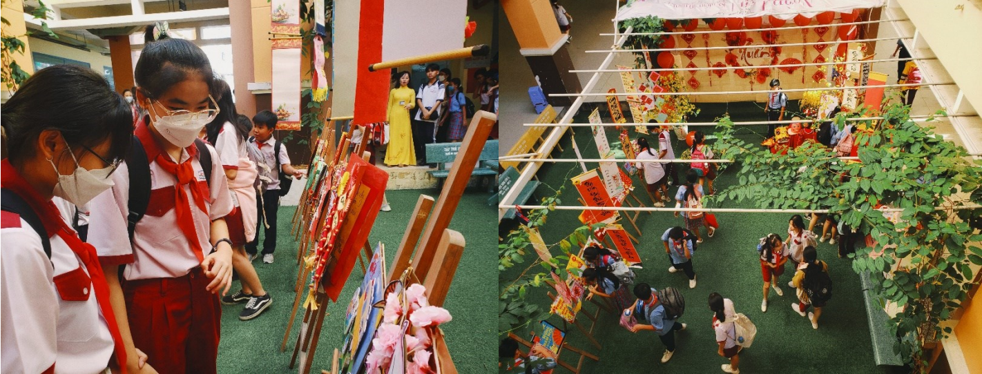
Hình ảnh: học sinh nhà trường vui chơi cùng với tiểu cảnh Xuân Yêu thương.