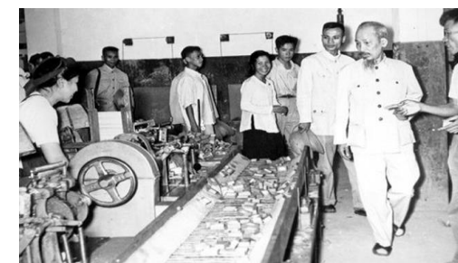
Bác Hồ thăm công nhân

Sự lớn mạnh của giai cấp công nhân là một điều kiện tiên quyết bảo đảm thành công của công cuộc đổi mới. Xây dựng giai cấp công nhân lớn mạnh phải gắn kết hữu cơ với xây dựng, phát huy sức mạnh của liên minh giai cấp công nhân với giai cấp nông dân và đội ngũ trí thức dưới sự lãnh đạo của Đảng, của tất cả các giai cấp, các tầng lớp xã hội trong khối đại đoàn kết toàn dân tộc; đồng thời tăng cường quan hệ đoàn kết, hợp tác quốc tế với giai cấp công nhân trên toàn thế giới; chống lại mọi âm mưu chia rẽ tổ chức Công đoàn, chia rẽ giai cấp công nhân, chia rẽ khối đại đoàn kết toàn dân tộc.