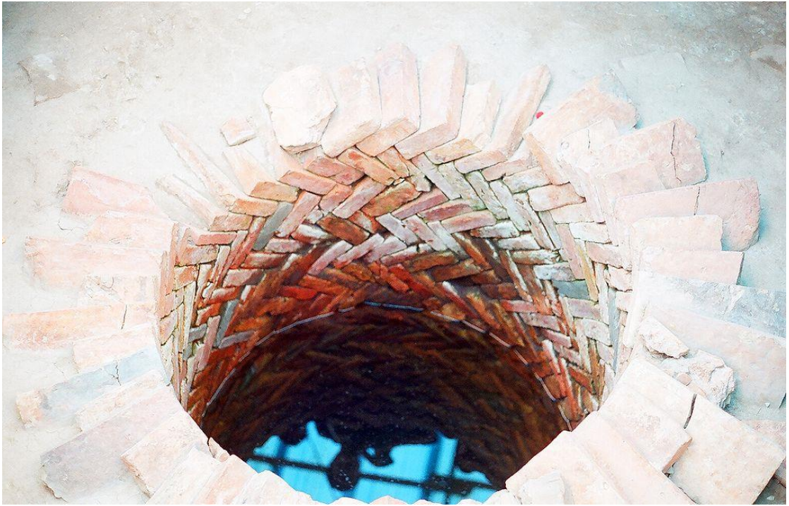
(Giếng nước thời Trần, gạch ghép kiểu lá nem rất kiên cố)