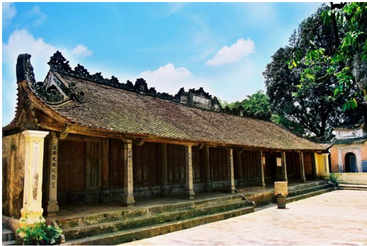
Chùa Bôi Khê huyện Thanh Oai, TP. Hà Nội.