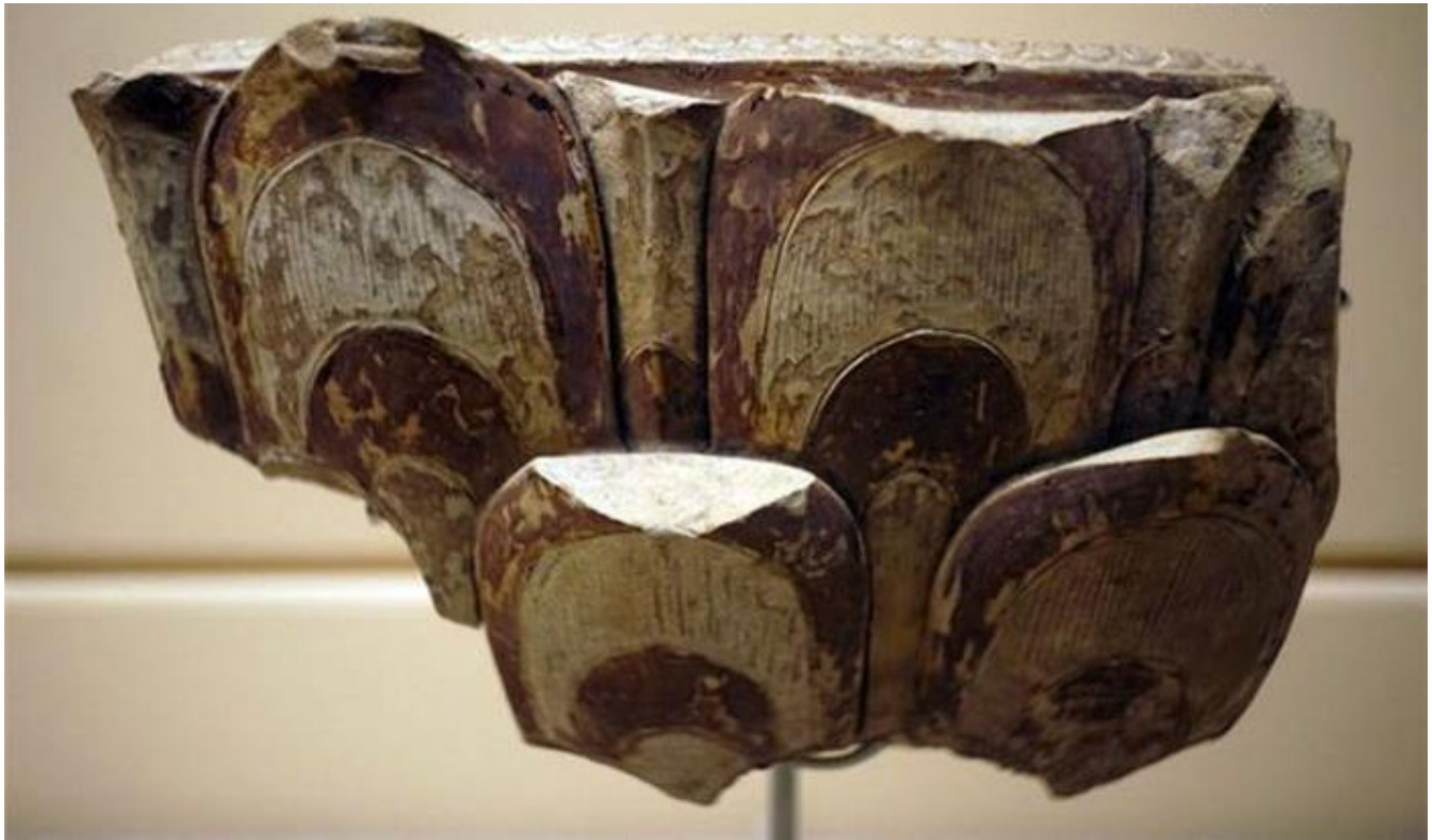
(Mảnh thống gốm hoa nâu trang trí hình cánh sen. Trang trí nổi theo phong cách phù điêu cũng góp phần làm phong phú và tăng thêm tính hoành tráng cho sản phẩm gốm hoa nâu).