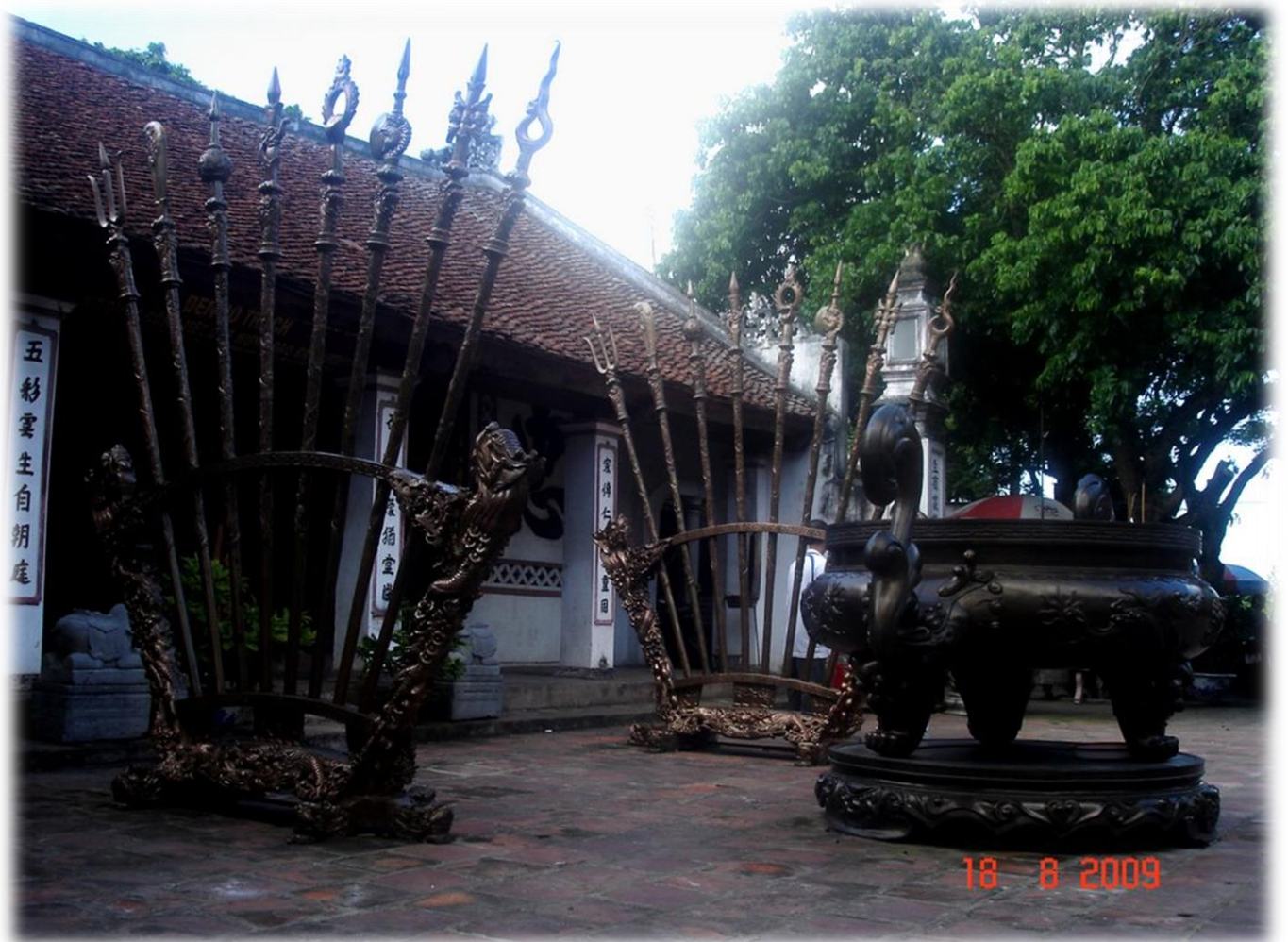
Đền Cổ Trạch