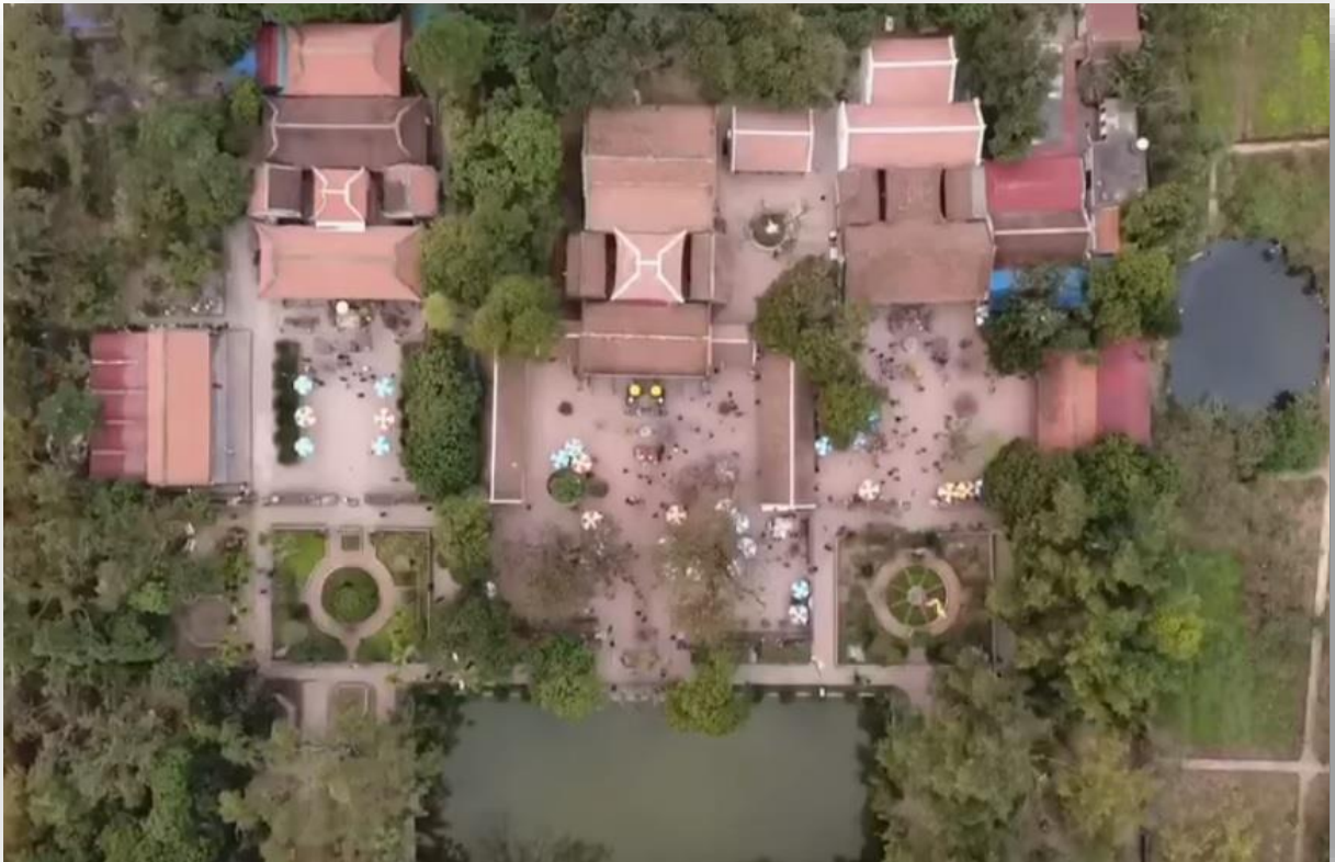
(Quần thể đền Trần, Nam Định, Chính giữa ảnh là đền Thiên Trường, bên phải là đền Cổ Trạch, bên trái là đền Trùng Hoa)