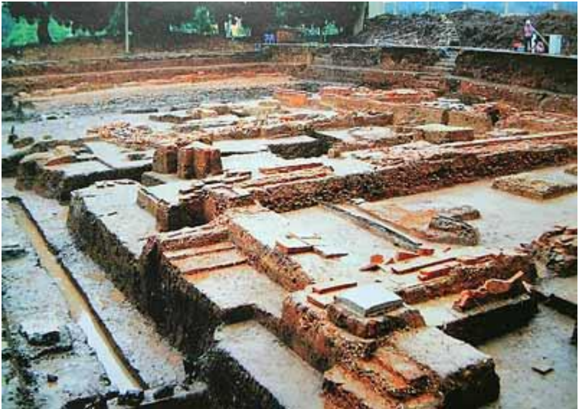
(Một phần của khu di tích kinh thành Thăng Long )