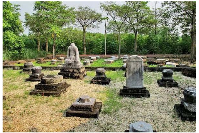
Khu lăng mộ An Sinh xã Đông Triều , tỉnh Quảng Ninh