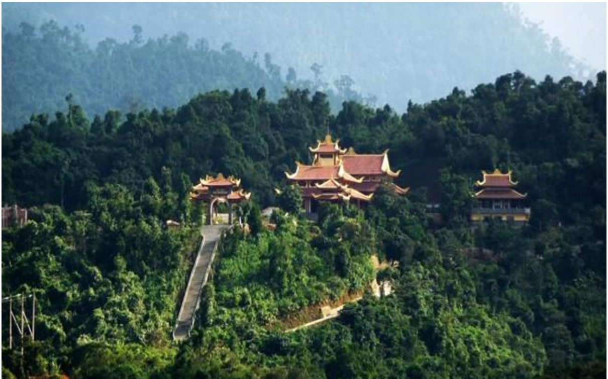
Các chùa ở núi Yên Tử

Nhà Trần đã xây dựng những ngôi chùa, tháp nổi tiếng như: