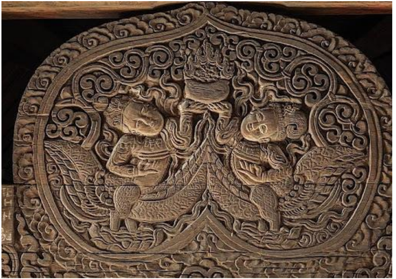
(Bức chạm khắc 2 Tiên nữ đầu người, mình chim dâng hoa, chùa Thái Lạc, Hưng Yên)