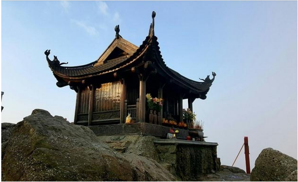
Chùa Đòng ở vị trí cao nhất của đỉnh núi Yên Tử