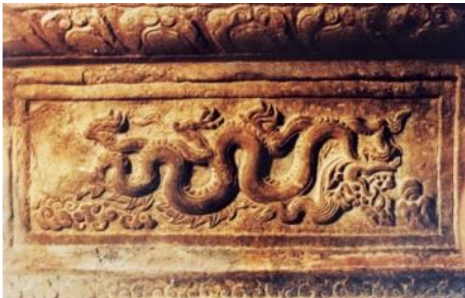
(Phù điêu rồng trên ngói bờ triều Trần)