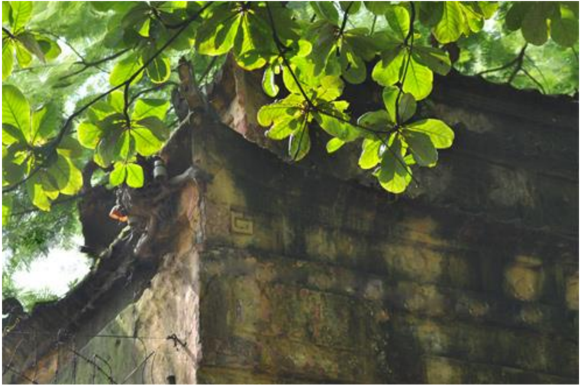
(Cổng dẫn vào điện Kính Thiên được xây gạch với kiểu nóc mái chồng 2 lớp)