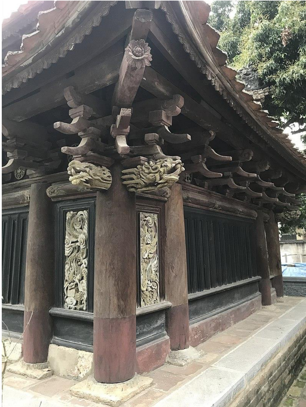
(Cận cảnh bộ đầu củng và chạm khắc ở Hậu cung_ chùa Bối Khê)