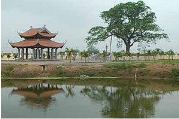
Lăng mộ Thống quốc thái sư Trần Thủ Độ tại xã Liên Hiệp huyện Hưng Hà (Thái Bình)

Nhà Trần còn xây các khu lăng mộ nổi tiếng như: