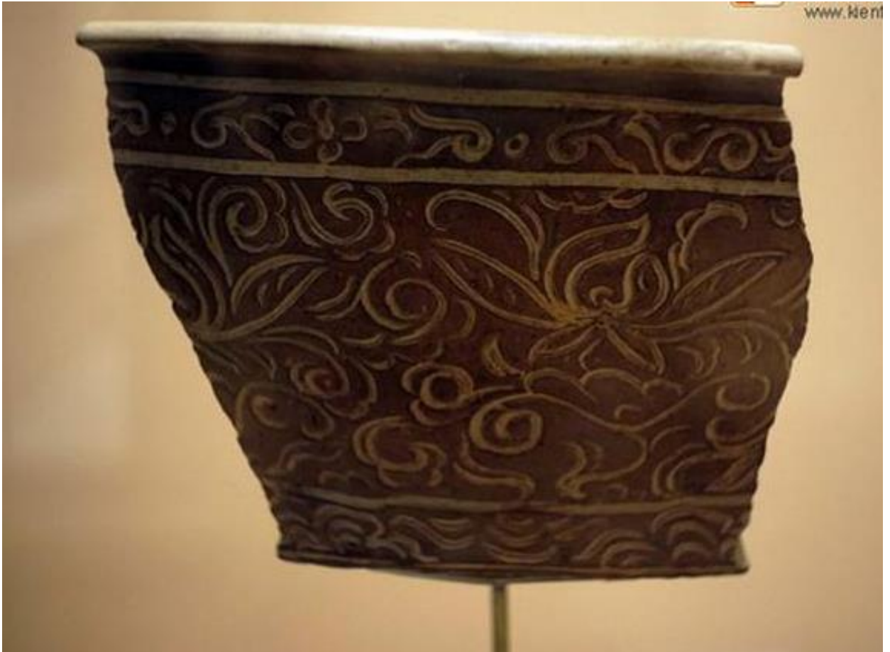
(Mảnh chậu gốm hoa nâu trang trí hoa cúc dây.)