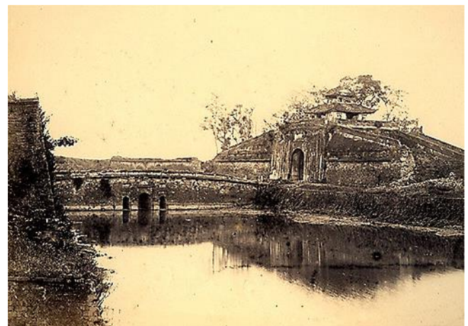
(Đoan Môn - cửa chính đi vào Hoàng thành Thăng Long)