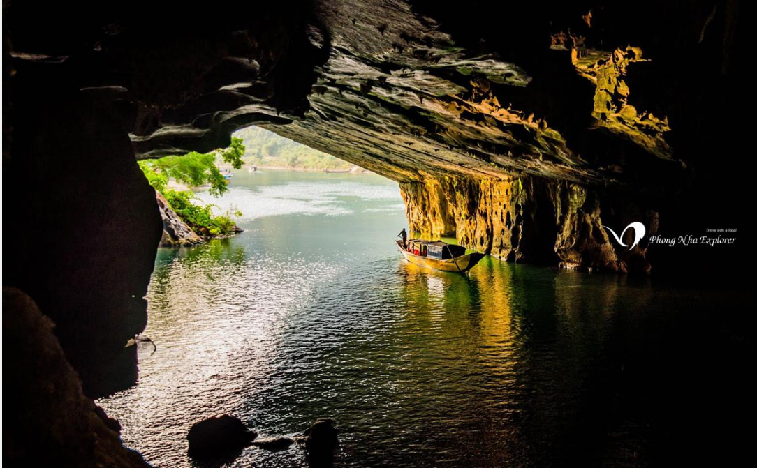
Từ bên trong của hang nhìn ra ngoài

Theo thuyền độc mộc bồng bềnh vào hang sâu, bóng tối trong hang làm cho các ánh nhũ của các thạch đá, sáng lấp lánh huyền ảo, đẹp lạ lùng. Xuôi thuyền hơn 600m đường nước trong động, du khách được thưởng thức vẻ đẹp thiên nhiên kì vĩ đến choáng ngợp của “Đệ nhất động”.