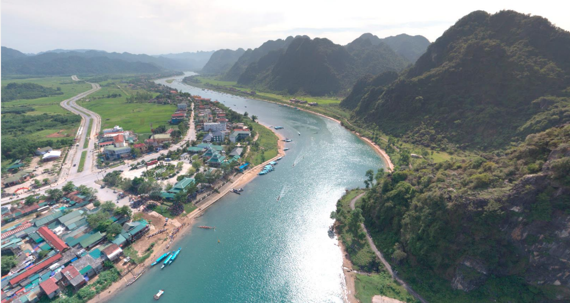
Toàn cảnh bến thuyền Sông Son nơi bắt đầu tham quan Động Phong Nha

Từ Thành Phố Đồng Hới tỉnh Quảng Bình đi đường Phan Đình Phùng theo đường Hồ Chí Minh để bắt đầu chuyến du lịch khám phá động Phong Nha “Di sản thiên nhiên thế giới Phong Nha-Kẻ Bàng”, đến Phong Nha, Du khách xuống bến thuyền đi theo sông Son vào động Phong Nha.