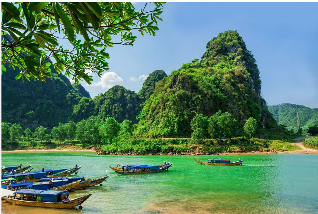
Phong cảnh sông núi hữu tình

Từ Thành Phố Đồng Hới tỉnh Quảng Bình đi đường Phan Đình Phùng theo đường Hồ Chí Minh để bắt đầu chuyến du lịch khám phá động Phong Nha “Di sản thiên nhiên thế giới Phong Nha-Kẻ Bàng”, đến Phong Nha, Du khách xuống bến thuyền đi theo sông Son vào động Phong Nha.