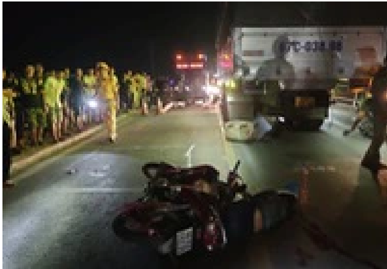
Một buổi tối xảy ra 2 vụ tai nạn giao thông làm 2 người chết