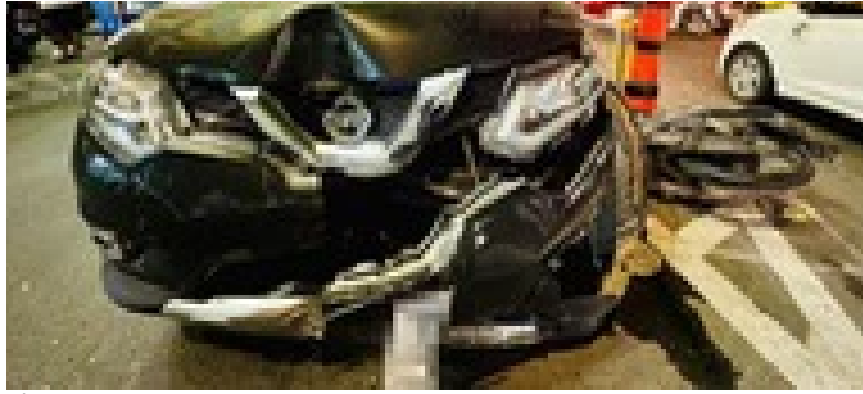
Sở Y tế TP.HCM thông tin vụ việc một bác sĩ gây tai nạn giao thông