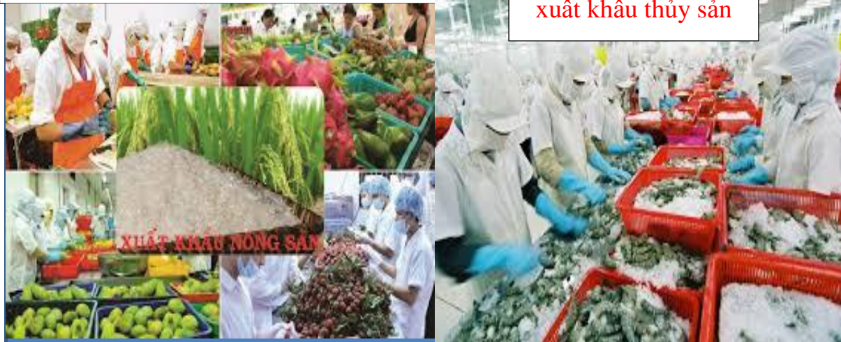
XUẤT KHẨU NÔNG SẢN