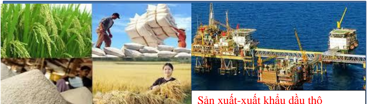
Sản xuất-xuất khẩu dầu thô

Các em hãy xem một số hình ảnh sau đây để thấy đất nước ta có những thay đổi, tiến bộ gì về đổi mới kinh tế.?