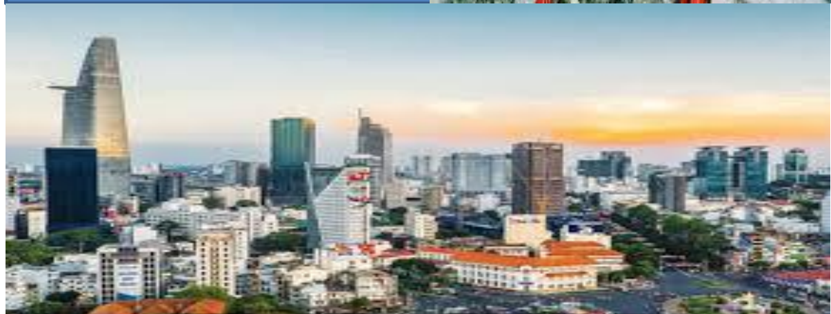
Phát triển của thành phố Hồ Chí Minh.