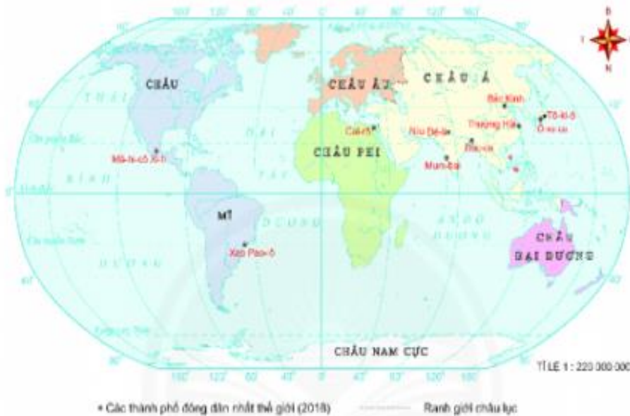
Hình 22.3. Các thành phố đông dân nhất thế giới (2018).