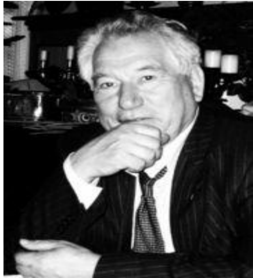
Nhà văn Ai – ma – tốp