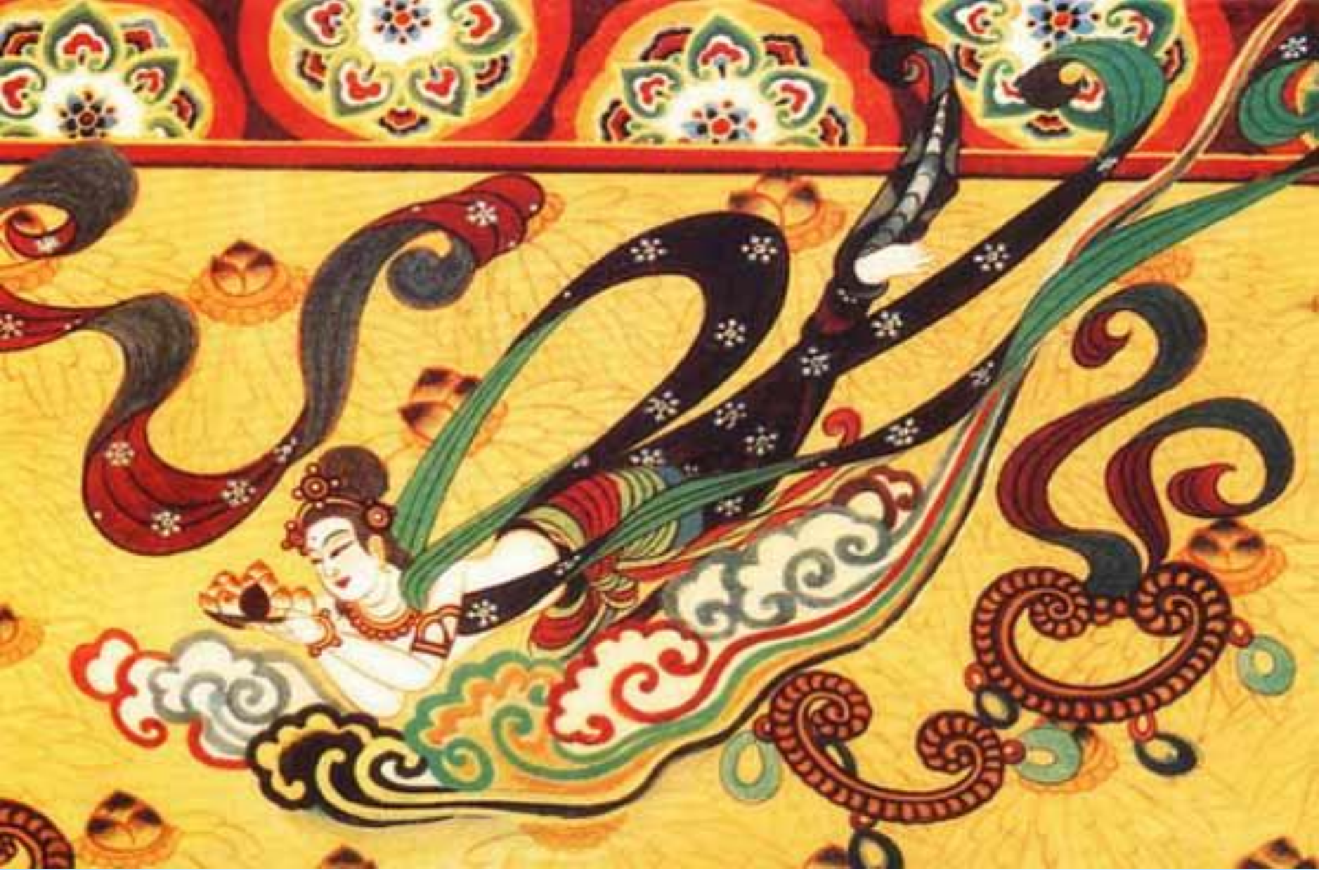
BÍCH HỌA Ở HANG MẠC CAO (ĐÔN HOÀNG - TRUNG QUỐC)