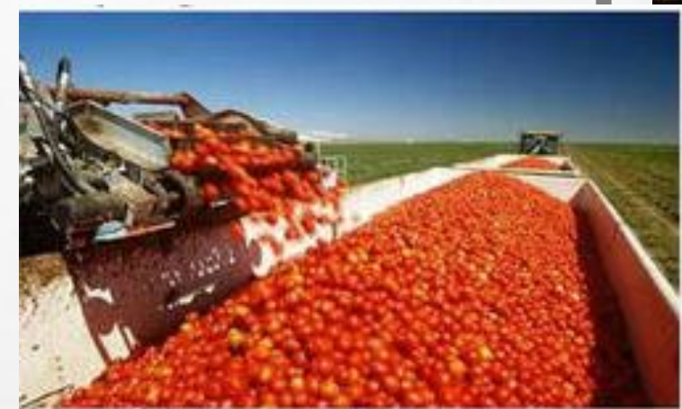
Hình 4. Thu hoạch cà chua ở Hoa Kỳ