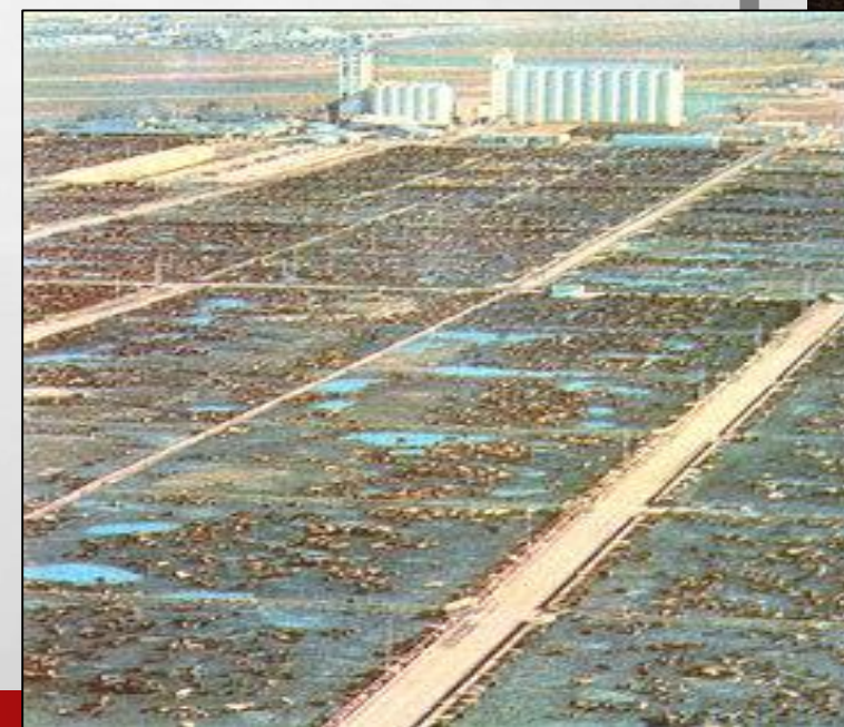
Hình 5. Chăn nuôi bò theo kiểu công nghiệp ở Hoa Kỳ