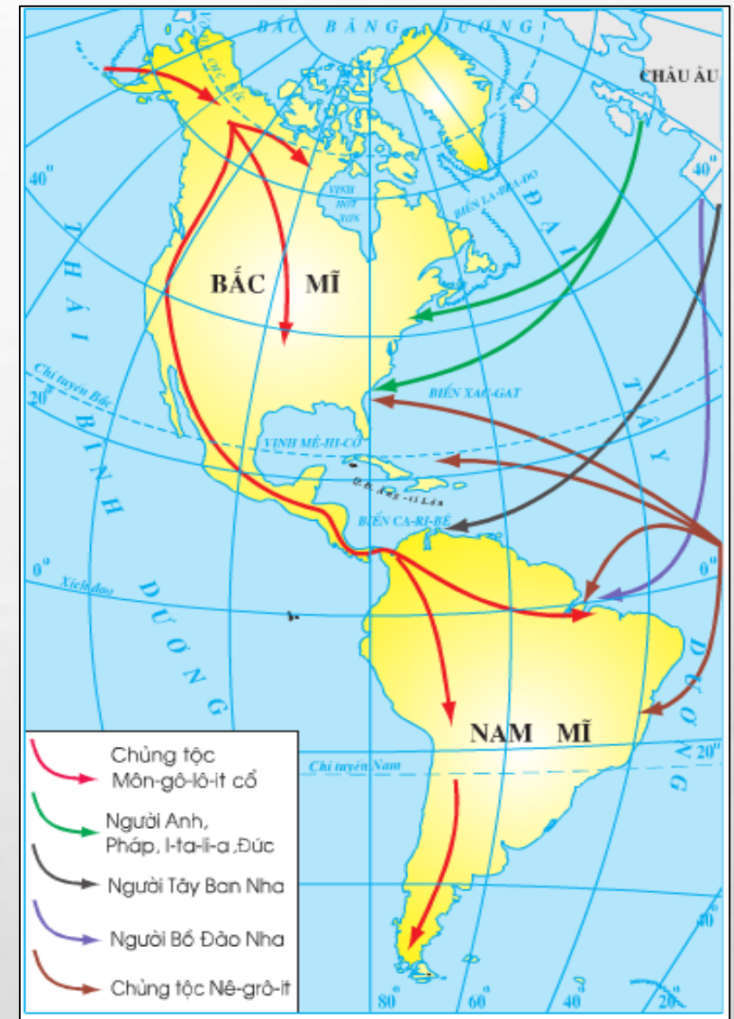
Hình 3. Lược đồ các luồng nhập cư châu Mỹ

⚠ Lưu ý: Sử dụng hệ quy chiếu khác nhau và quá trình thao tác nên kích thước trên lược đồ chỉ mang tính tương đối.