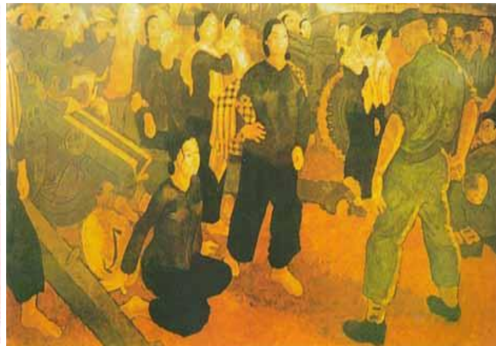
Trái tim và nòng súng-1963 ( sơn mài-Huỳnh Văn Gấm )