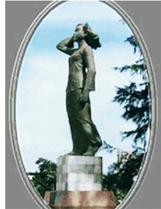
Võ Thị Sáu - 1956 Diệp Minh Châu