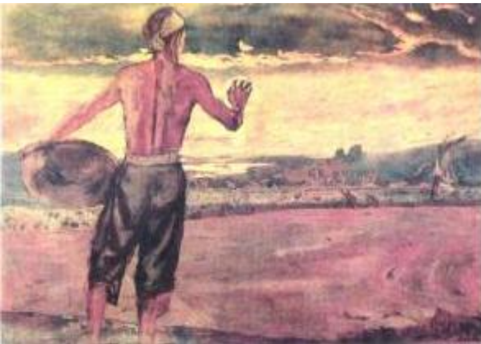
Bình minh trên nông trang ( sơn mài-Nguyễn Đức Nùng )