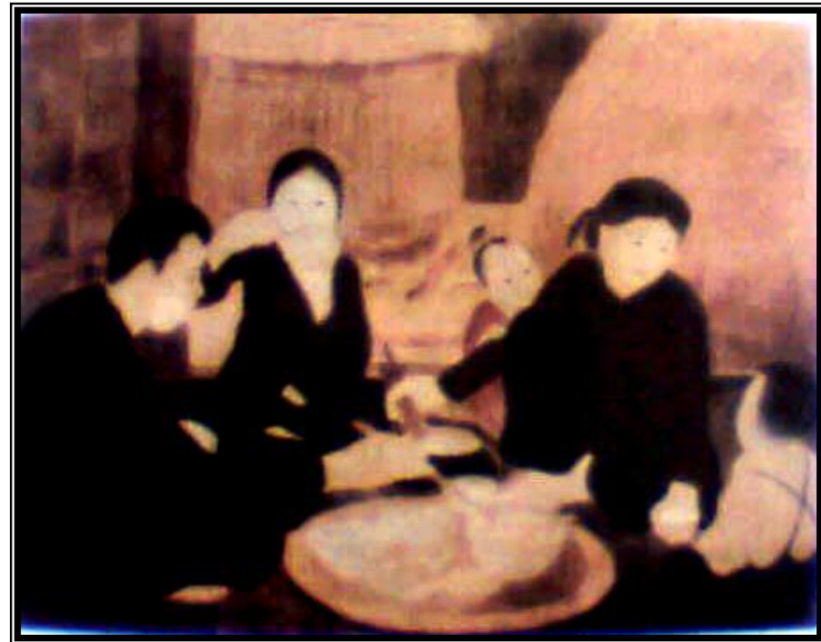
Bữa cơm mùa thắng lợi - 1960 ( tranh lụa - Nguyễn Phan Chánh )