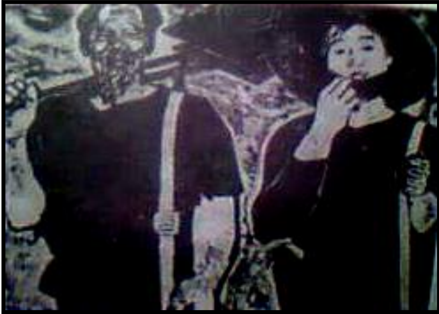
Ông cháu -1966