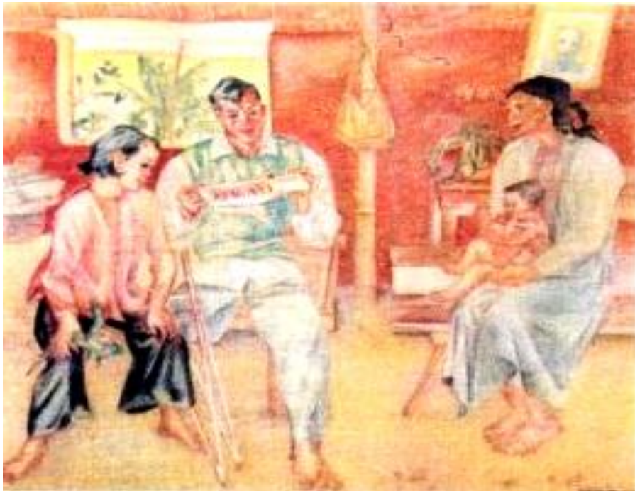
Con đọc bầm nghe ( tranh lụa-Trần Văn Cẩn )