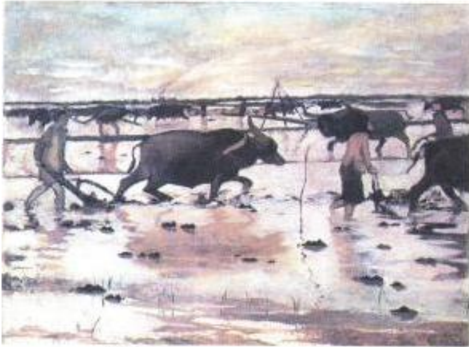
Một buổi cày-1960 (Sơn dầu-Lưu Công Nhân)