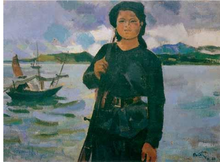
Nữ dân quân miền biển – 1960 (Sơn dầu-Trần Văn Cẩn)