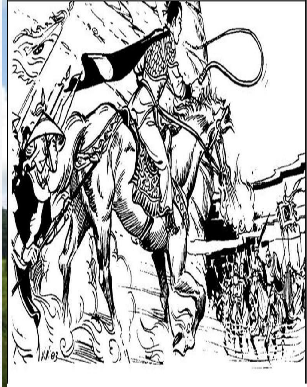
Quốc công tiết chế Trần Quốc Tuấn.