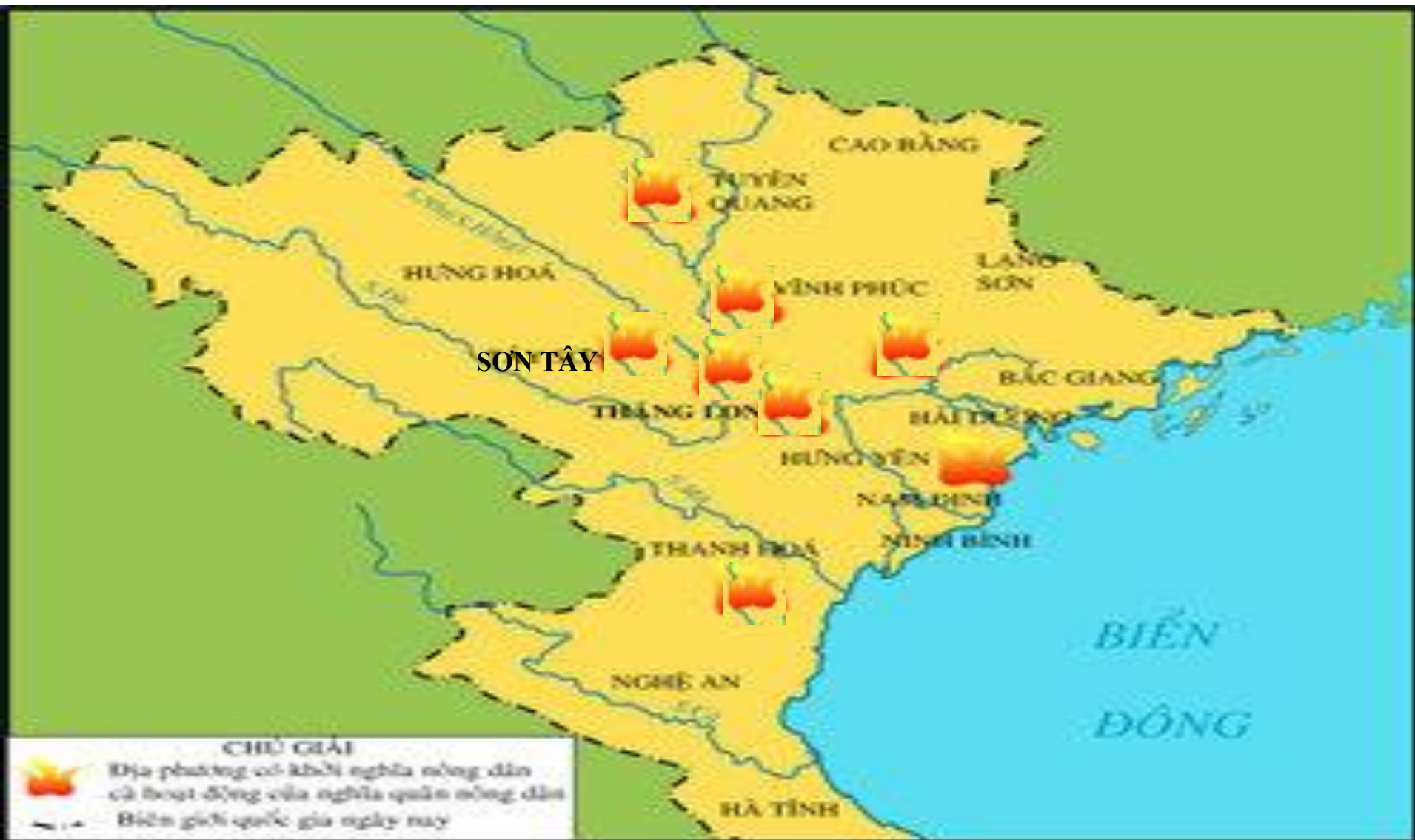
HÌNH 39. LƯỢC ĐỒ KHỞI NGHĨA NÔNG DÂN NỬA CUỐI THẾ KỶ XIV