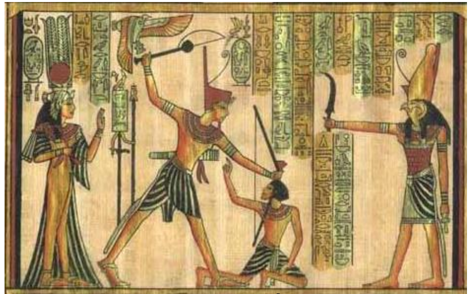
Vua Menes giết nô lệ

Do bị áp bức bóc lột nặng nề nên nô lệ và nông dân nghèo nổi dậy đấu tranh: ở La gát năm 2.300TCN, ở Ai Cập năm 1.750 TCN