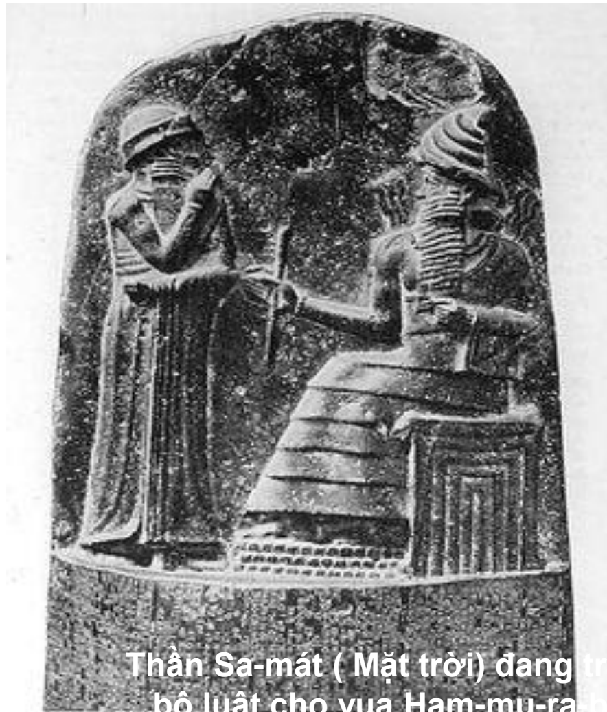
Thần Sa-mát ( Mặt trời) đang trình bày bộ luật cho vua Ham-mu-ra-bi

Do bị áp bức bóc lột nặng nề nên nô lệ và nông dân nghèo nổi dậy đấu tranh: ở La gát năm 2.300TCN, ở Ai Cập năm 1.750 TCN