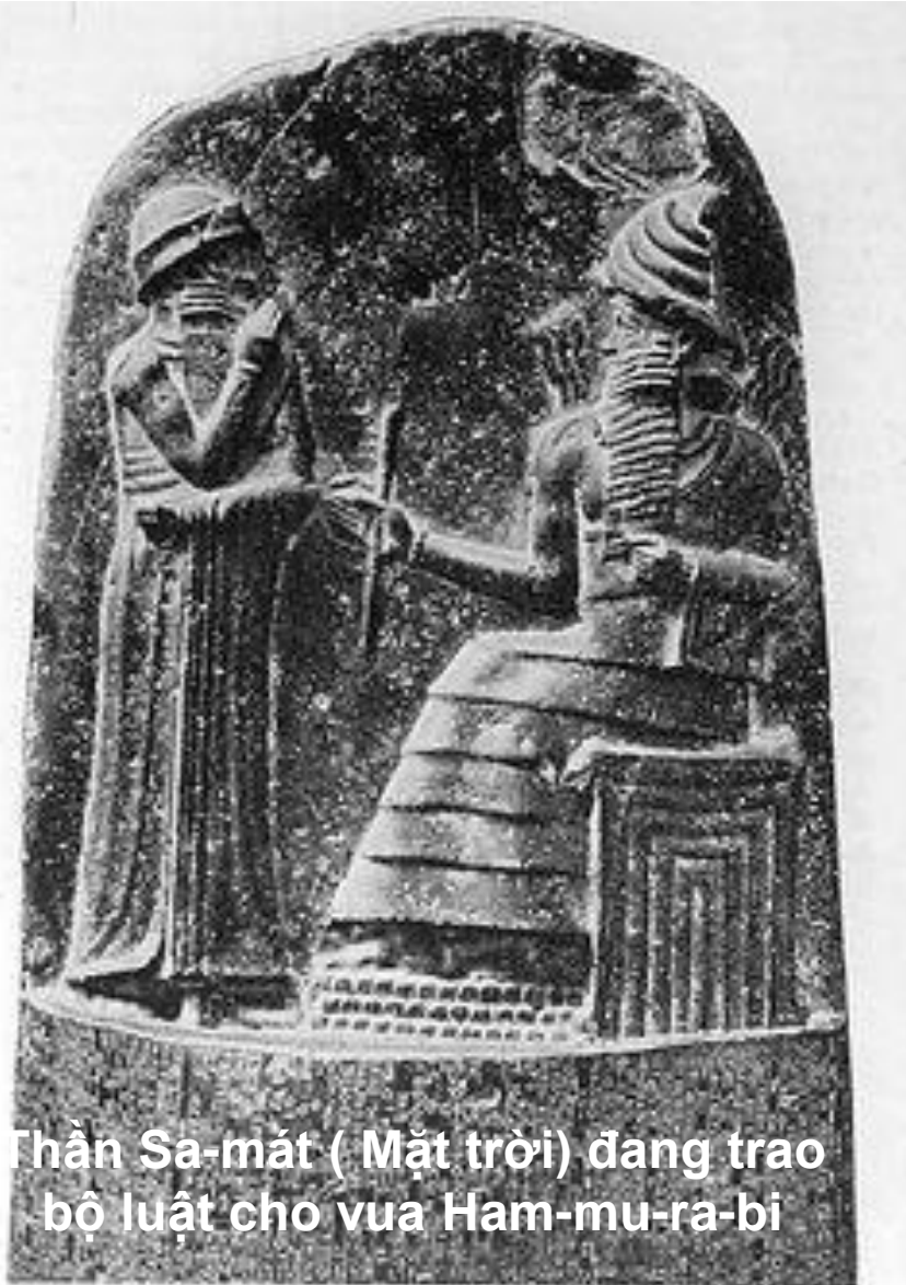
Thần Sa-mát ( Mặt trời) đang trao bộ luật cho vua Ham-mu-ra-bi

1. Qua hai điều luật trên theo em người cày thuê ruộng phải làm việc như thế nào? Em thấy bất công ở điểm nào?