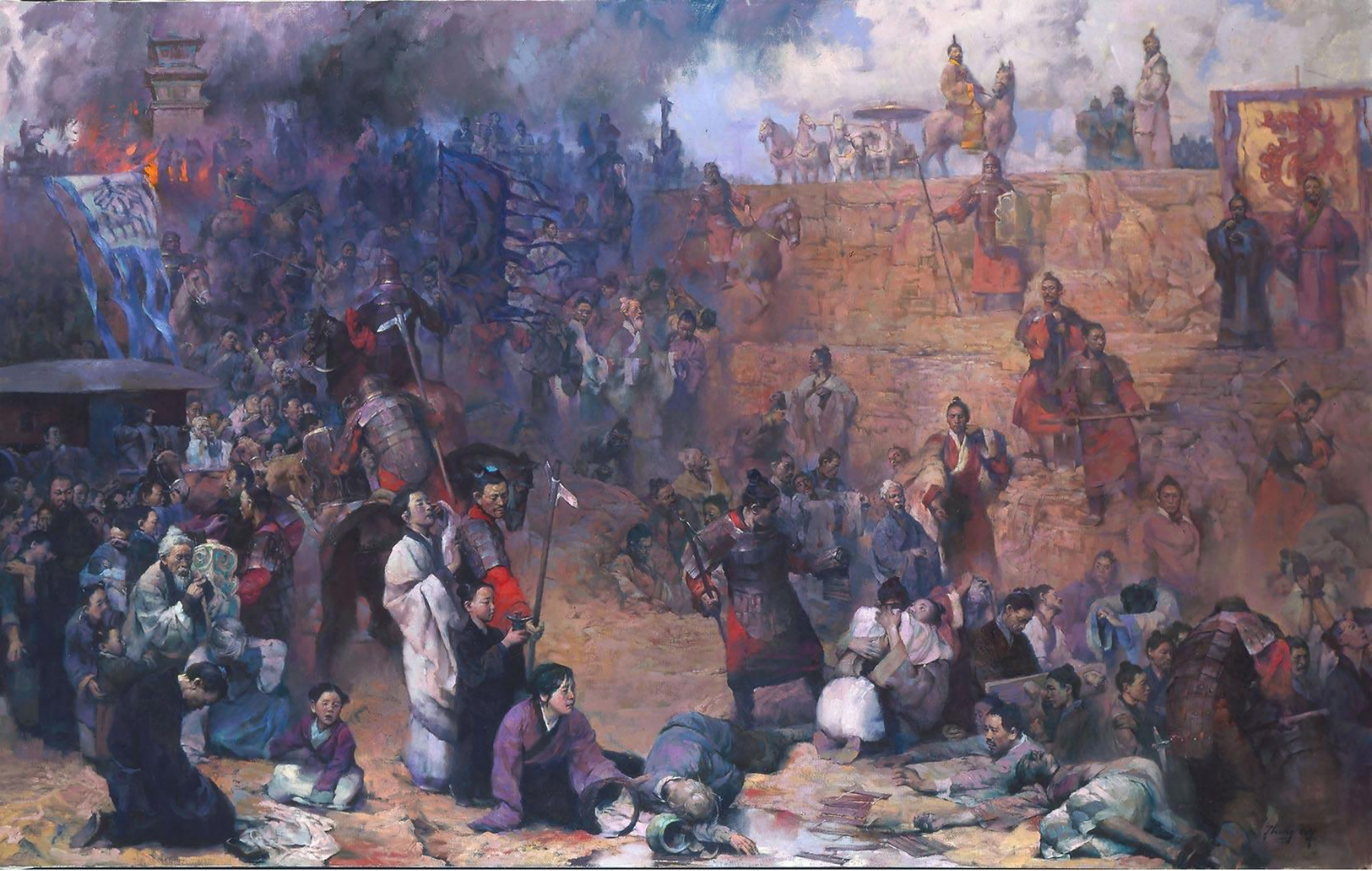
Quân Tần bắt dân chúng đi xây Vạn Lý Trường Thành