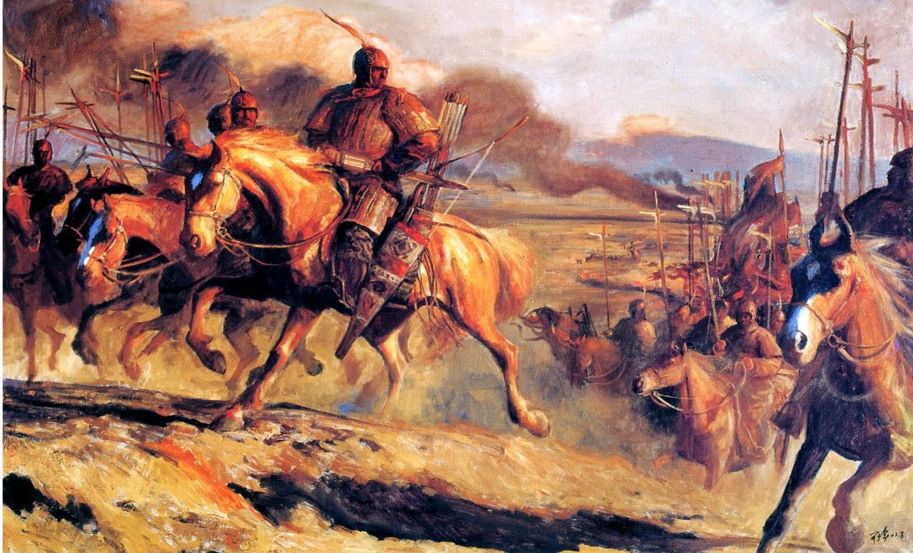
王可伟油画 - 霍去病收复河西