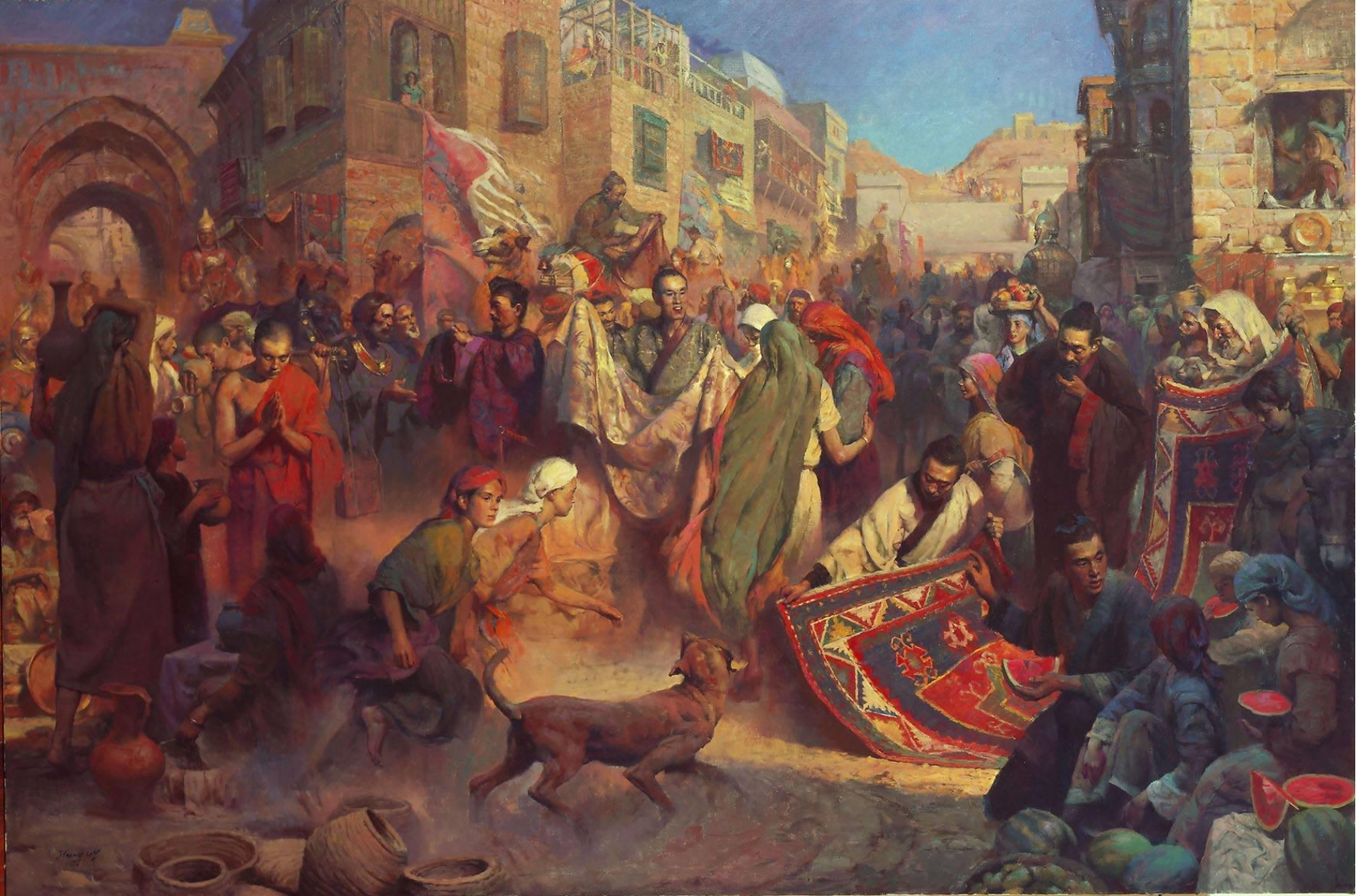
1 cảnh buôn bán tập nập tại 1 thị trấn trên con đường tơ lụa nối liền Trung Hoa với La Mã ở phương Tây thời Hán