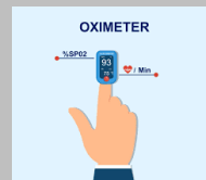
Máy đo SPO2 cầm tay