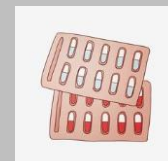
Thuốc hạ sốt dạng uống, đặt hậu môn , Oresol, thuốc ho, vimatin tổng hợp