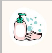
Nước sát khuẩn