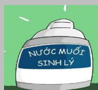
Nước muối sinh lý