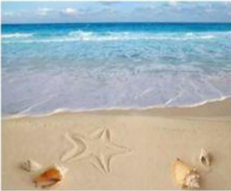
Cát trong nước biển

Hỏi 1 Hãy dùng từ huyền phù , dung dịch , nhũ tương để phân biệt hai dạng hỗn hợp: cát trong nước biển và muối trong nước biển