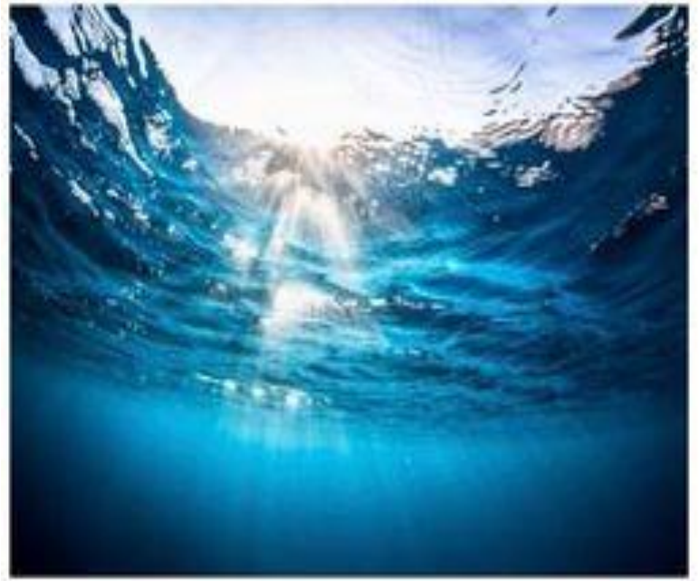
Muối trong nước biển