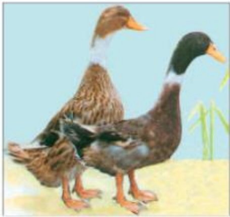
Hình 51. Vịt cỏ

Vịt Cỏ có nhiều màu lông khác nhau, có tầm vóc nhỏ bé, nhanh nhẹn, dễ nuôi.