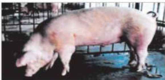
Hình 53. Lợn Lan đơ rat