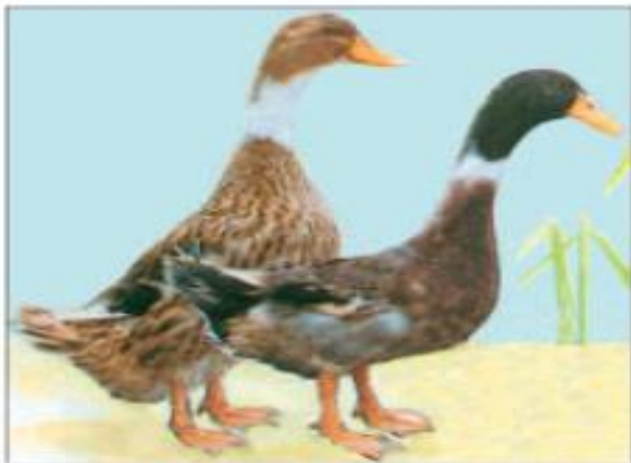
Hình 51. Vịt cổ