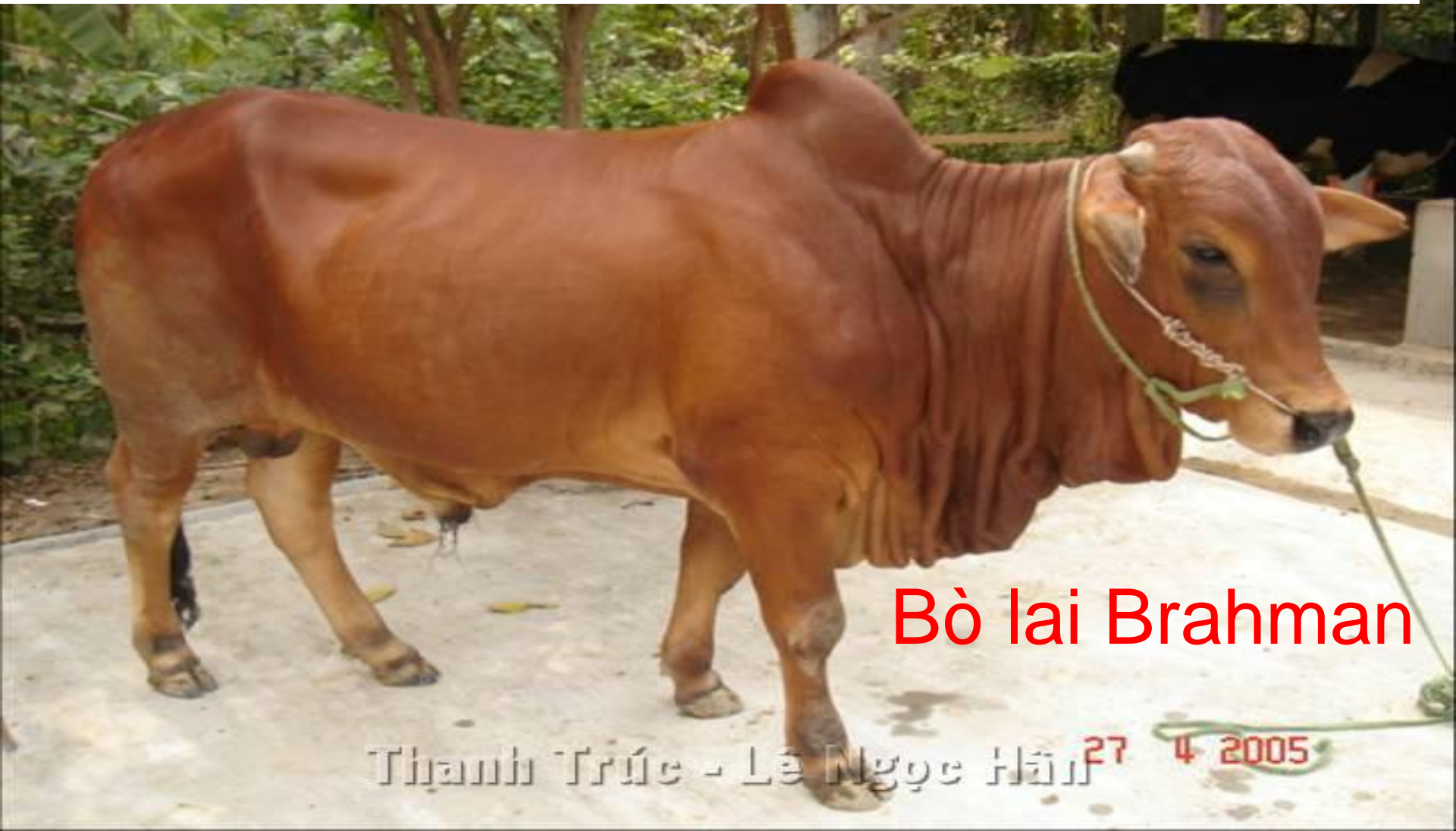
Bò lai Brahman