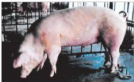
Hình 53. Lợn Lan đơ rat

Bò Hà Lan : chủ yếu có màu lang trắng đen, cho sản lượng sữa cao.