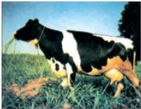
Hình 52. Bò sữa Hà Lan

Vịt Cỏ có nhiều màu lông khác nhau, có tầm vóc nhỏ bé, nhanh nhẹn, dễ nuôi.