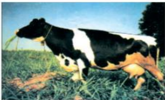
Hình 52. Bò sữa Hà Lan