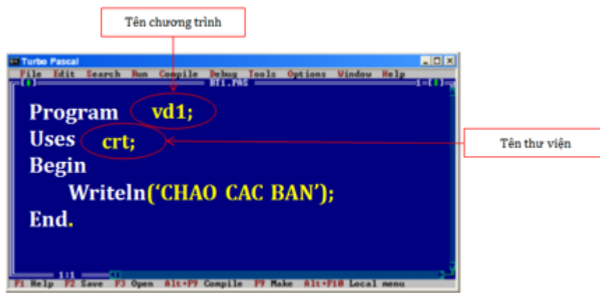
hình 2.1. chương trình in ra dòng chữ "chao cac ban"