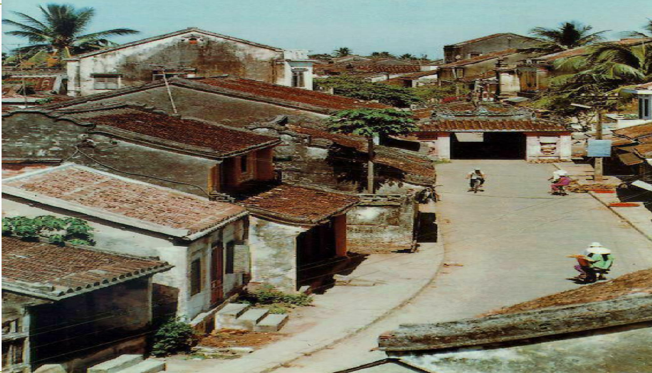
PHỐ CỔ HỘI AN