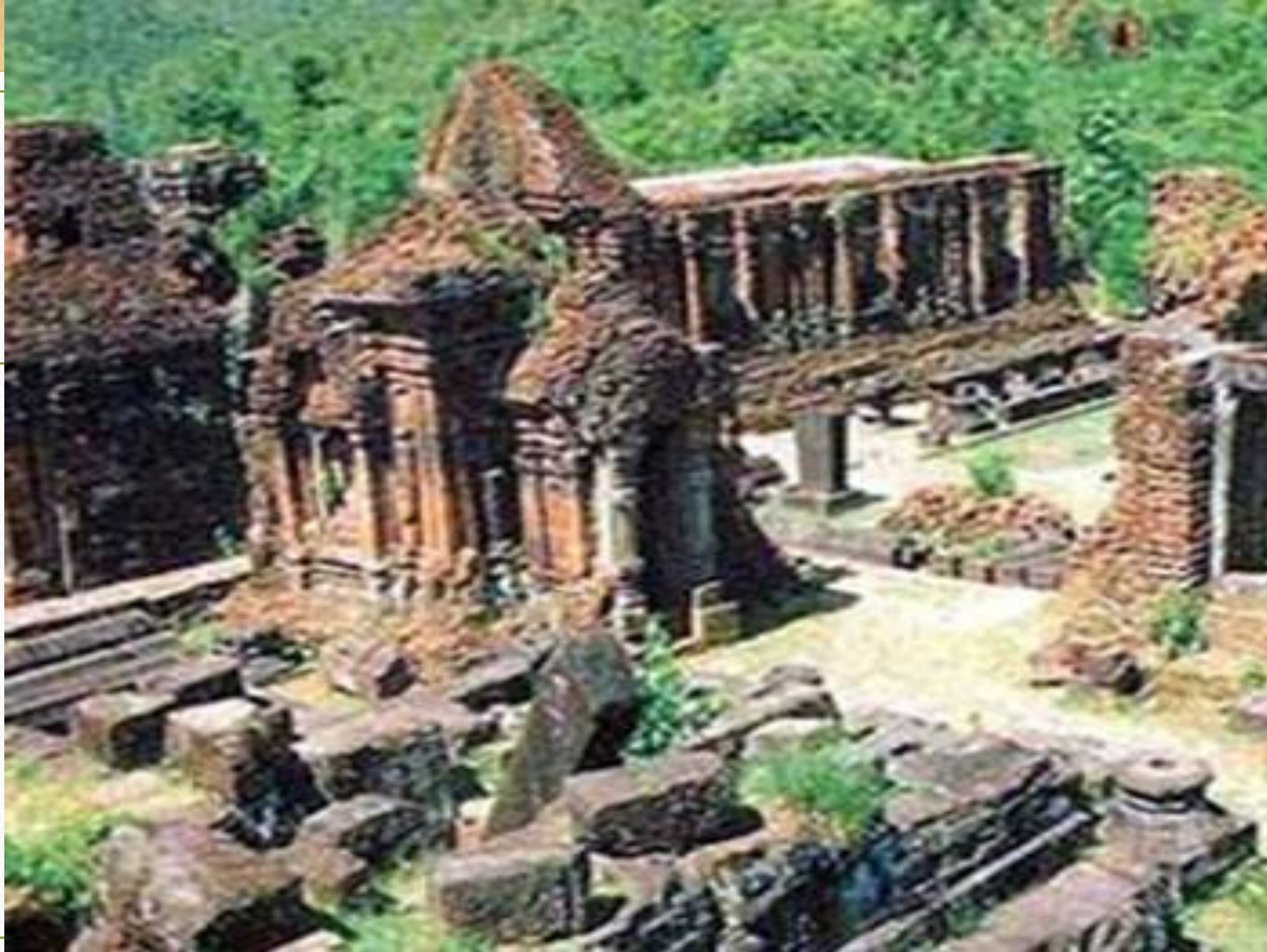
KHU DI TÍCH MỸ SƠN