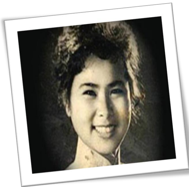
Nguyễn Thị Xuân Quỳnh