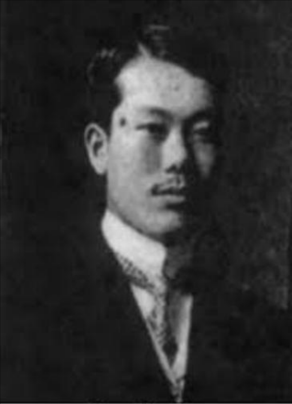
Phan Bội Châu