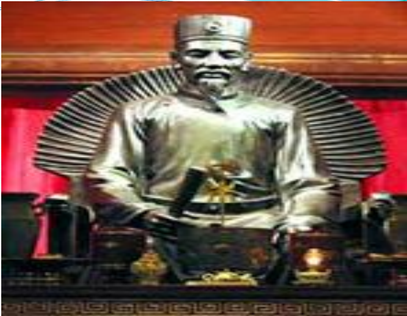
Thầy Chu Văn An