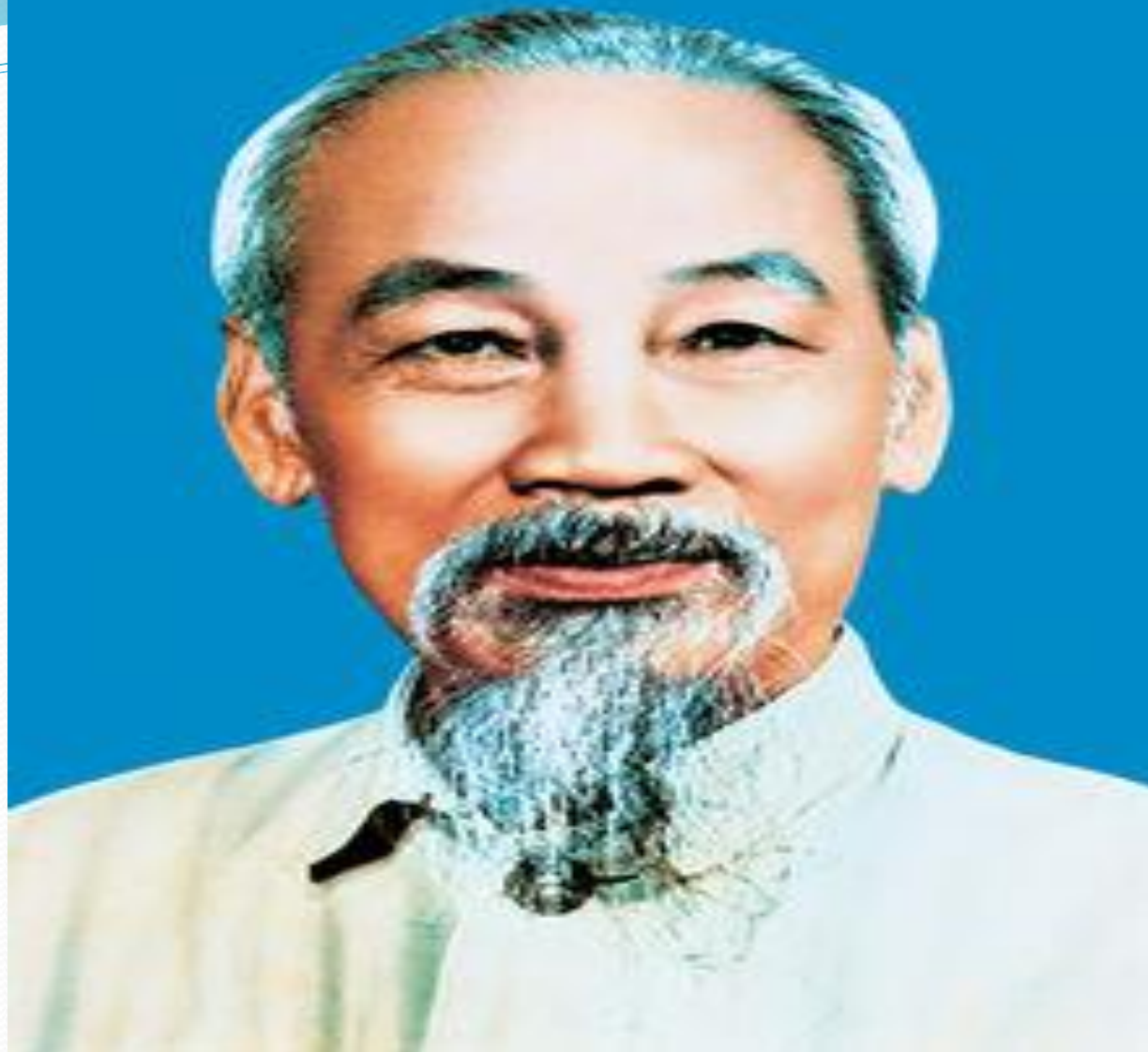
Chủ Tịch Hồ chí Minh