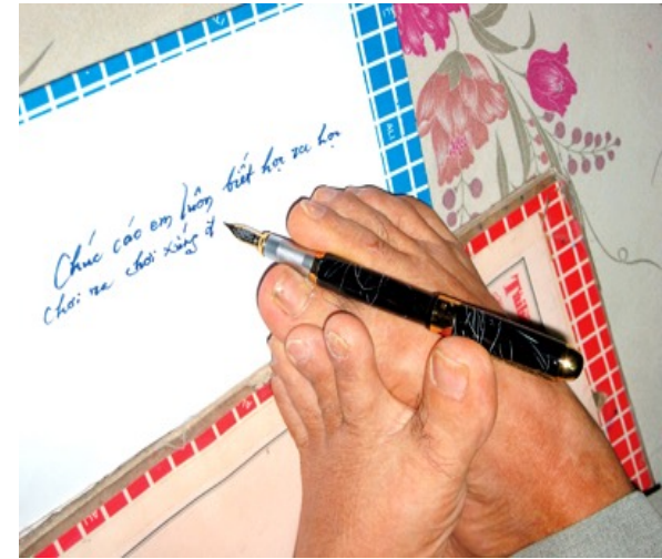
Thầy giáo Nguyễn Ngọc Ký