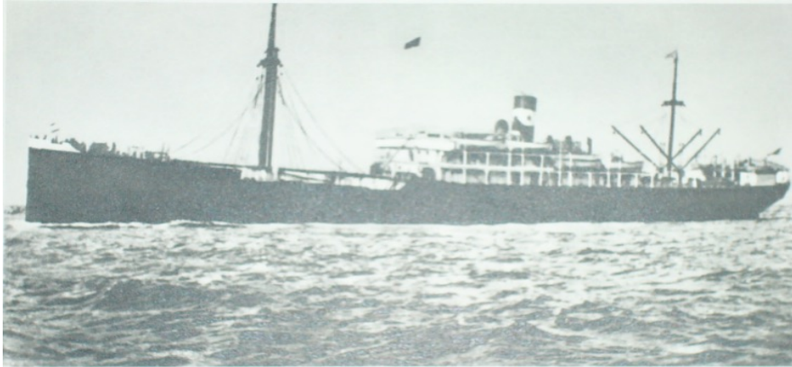
Trên chiếc tàu Pháp La-tút-sơ To-rê-vin này, năm 1911, người thanh niên yêu nước Nguyễn Tất Thành (tên lúc đó của Chủ tịch Hồ Chí Minh) rời Tổ quốc đi tìm đường cứu nước