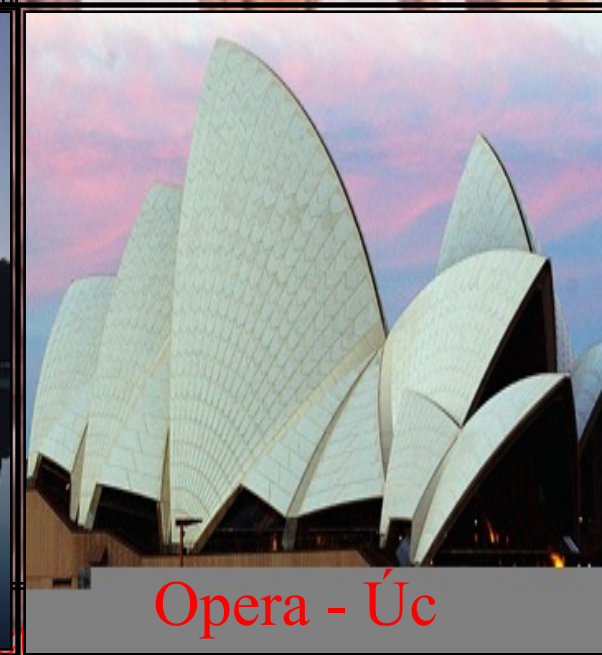
Opera - Úc

Vì sao con người đạt được những thành tựu trên?