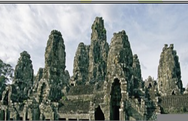
Ăng co Vát