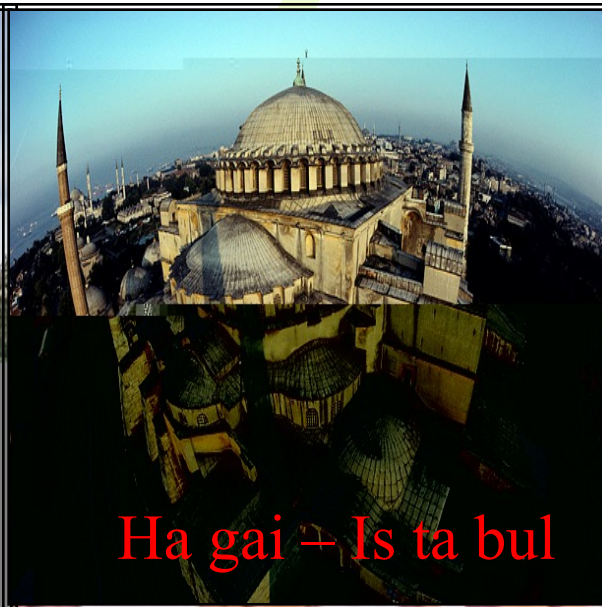
Ha gai – Is ta bul